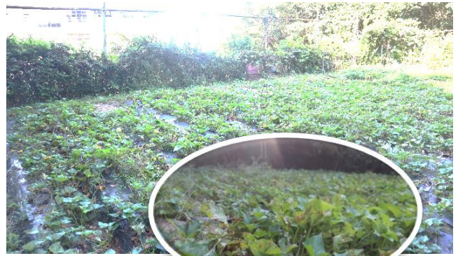
「PTAさつまいも」のようす

例年だと、この時期の中学校は合唱コンクールに文化発表会にと準備に入っており、生徒の活発な活動が見られますが、今年は 合唱コンクールは中止 とし、文化発表会は 各学年の「総合的な学習の時間」 の内容を何組かの 代表が発表する会 とさせていただきます。また、本年度も 無観客 として生徒の学習の成果を保護者や地域の方々に観ていただくことができず誠に残念です。引き続き新型コロナウイルス感染症対策を徹底しながら、心に残る発表会にしていきたいと思います。