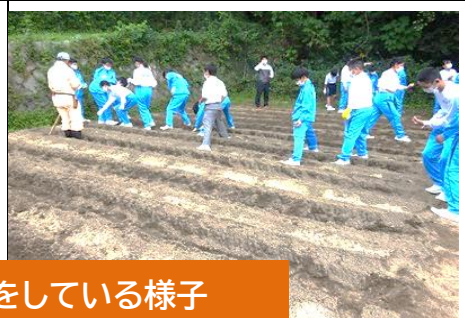
1年生が民生委員さんとじゃがいもの植付をしている様子