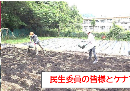
民生委員の皆様とケナフの畑づくり