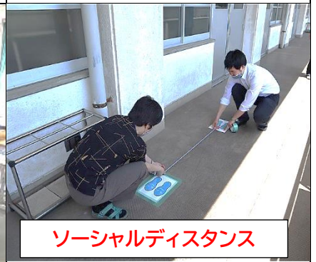
ソーシャルディスタンス

令和2年6月1日(月)から学校が再開しました。 朝会 でこれからの生活について話し、1時間目の学活で ソーシャルスキルトレーニング をしました。ゲームを通して和やかな雰囲気が作られ、授業がスタートしました。午後からは、民生委員の皆様にご協力いただき、5日(金)の ケナフ の植付に向けた畑作りをしました。ありがとうございました。また、2年生は、3年生に引き続き、 マスクづくり に挑戦しました。ミシンの使い方に慣れていている生徒が多く、順調にできあがっていました。