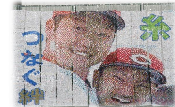
(令和4年生徒作成のエコキャップアート)

新制中学校発足の昭和22年、広く全校生徒、教職員の間から募集した。横路の頭文字「Y」と中学校の「中」を図案化したもので。地域に密着した生徒としての誇りと自覚を象徴したものである。