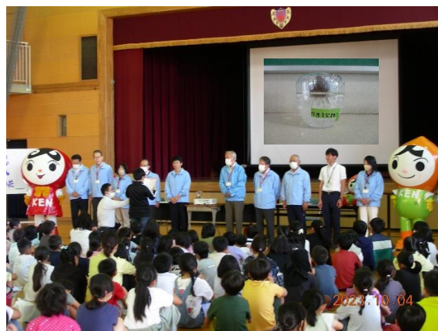
人権集会での交流