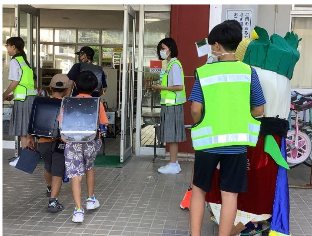
あいさつ運動での呼びかけ