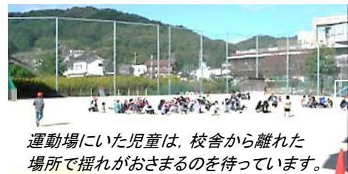
運動場にいた児童は、校舎から離れた場所で揺れがおさまるのを待っています。

広島県の一斉防災訓練に合わせて、大地震そして津波警報が発令されたことを想定した避難訓練を行いました。災害はいつ、どの場面で、どのように起こるか誰にも分かりません。「訓練」だからこそ、自分の命は自分で守るために、自分事として真剣に取り組むことをこれからも指導していきます。