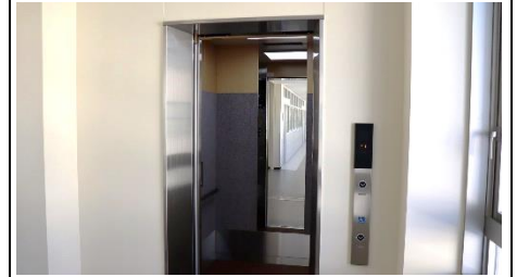
エレベーターができました！