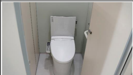
トイレは温水シャワー付きです。