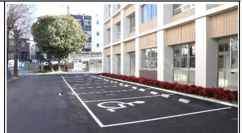
玄関前の駐車場。身障者用もあります。

新校舎(特別棟)が完成し、2月27日(月)に引き渡しがありました。今後は内部の備品等の設置を行い、3月末には仮設校舎からの大引っ越しを行います。