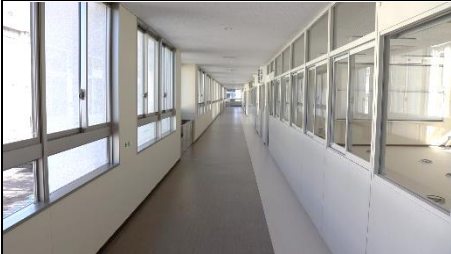
廊下が広くなった気がします。