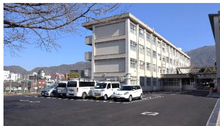
駐車場はたくさん止められるようになりました。