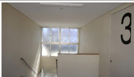
階の表示が大きくなりやすいですね。