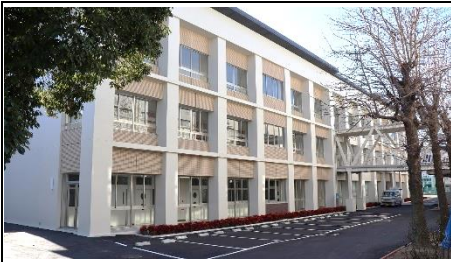
旧校舎同様内廊下の建物です。

新校舎(特別棟)が完成し、2月27日(月)に引き渡しがありました。今後は内部の備品等の設置を行い、3月末には仮設校舎からの大引っ越しを行います。