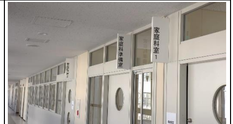
各部屋の表示もはっきりと見えます。