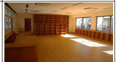
図書室は木目で落ち着いた感じです。