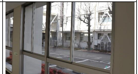
一つ一つの窓が大きく明るくなりました。

令和5年3月の主な行事予定 7(火) 3年生を送る会 8(水) 第74回卒業証書授与式 9(木) 公立高校一次選抜発表 17(金) 公立高校二次選抜