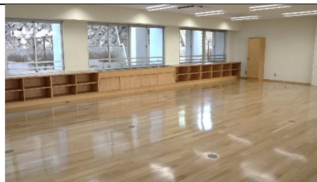
木工室もフローリングになっていました。