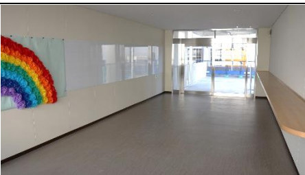
体育館への通路はバリアフリーに変わりました。