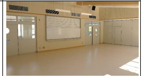
音楽室は正面が廊下側になってました。