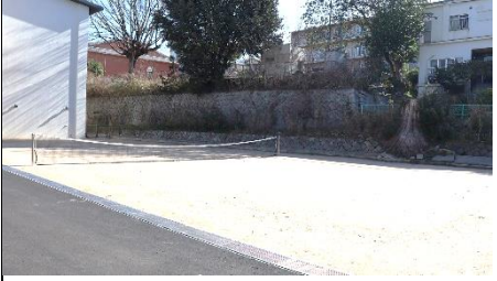
南門前にコートが移動しました。