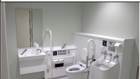
1階には身障者用のトイレもあります。