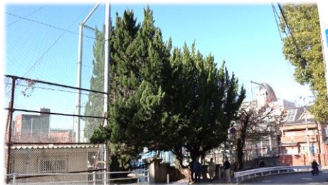
正門に被さっていた木をきれいに散髪しました(右)