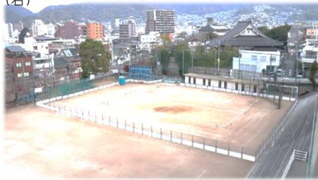
仮設校舎の縄張りができました。完成は3月末です。