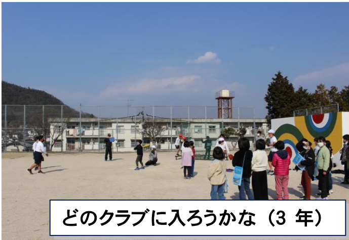
どのクラブに入ろうかな (3年)