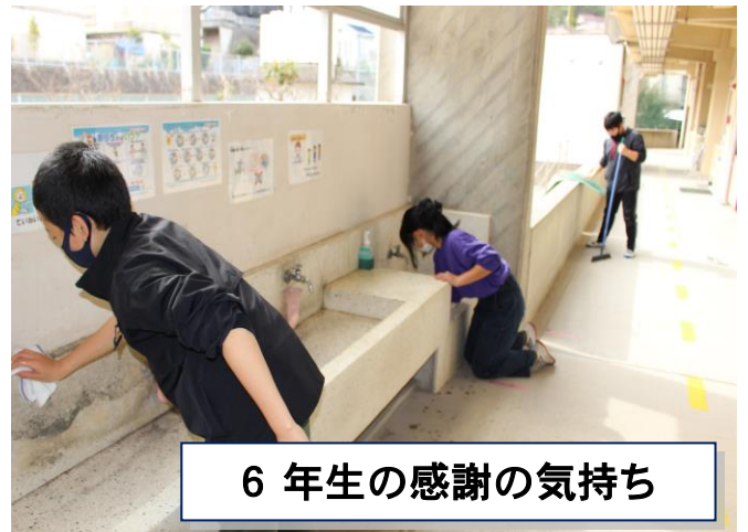
6年生の感謝の気持ち