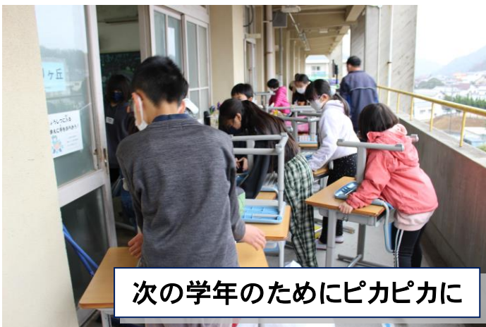
次の学年のためにピカピカに