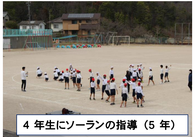
4年生にソーランの指導 (5年)