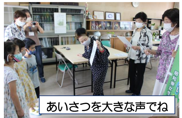
あいさつを大きな声でね

いつも地域の皆様からは、学校の教育や安全に対して、本当に温かなご協力をいただいています。これからも、地域や家庭とともにある南小をめざします。