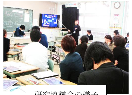
研究協議会の様子