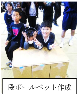
段ボールベット作成