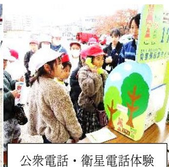
公衆電話・衛星電話体験