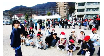
地域別縦割り班顔合わせ

1月28日(金)に片山中学校区地域総合防災訓練が片山中学校で開催され、全学年で参加しました。第5分団消防団の皆様に見守りながら誘導していただき、6・1年、5・3年、4・2年のグループで片山中学校に移動できました。今年度は、自分が住む地域に住んでいる人を確認するため、最初に地域ごとの縦割り班に分かれ、中学生のリーダーの点呼によりお互いの顔と名前を確認しました。その後、移動グループごとに煙中訓練、公衆電話・衛星電話体験、給水訓練、初期消火訓練を行いました。今年度は、体験と体験の合間の待ち時間に、中学生が行う活動を見学することもできました。災害時を想定した体験やより人と人とのつながりを感じる体験を行うことができました。片山中学校区地域総合防災訓練実行委員会の皆様はじめ関係諸機関の皆様、本当にありがとうございました。