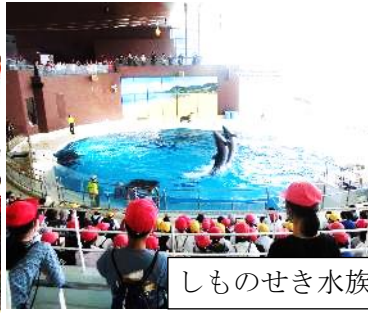
しものせき水族館海響館