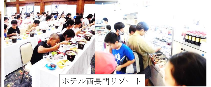
ホテル西長門リゾート