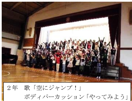
2年 歌「空にジャンプ！」 ボディパーカッション「やってみよう」