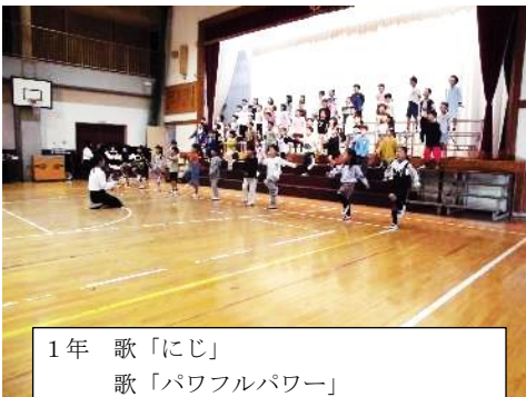
1年 歌「にじ」 歌「パワフルパワー」

10月21日に学習発表会を行いました。4年ぶりに来賓の皆様もお迎えし、日ごろの学習の成果を見ていただきました。スムーズな進行のために、受付や誘導、駐車場等の準備や運営に携わってくださったPTA役員やボランティアの皆様、ご協力ありがとうございました。