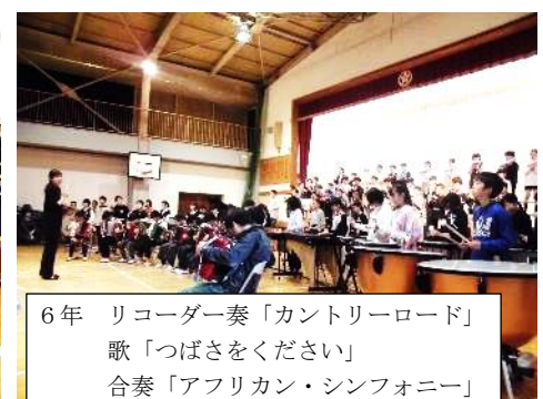
6年 リコーダー奏「カントリーロード」 歌「つばさをください」 合奏「アフリカン・シンフォニー」