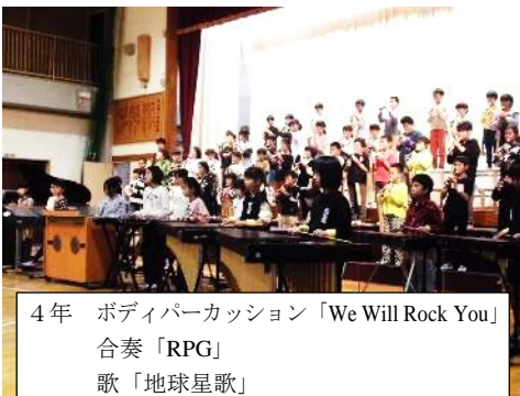
4年 ボディパーカッション「We Will Rock You」 合奏「RPG」 歌「地球星歌」