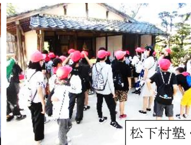
松下村塾・松陰神社