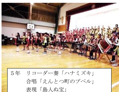
5年 リコーダー奏「ハナミズキ」 合唱「えんとつ町のプペル」 表現「島人ぬ宝」