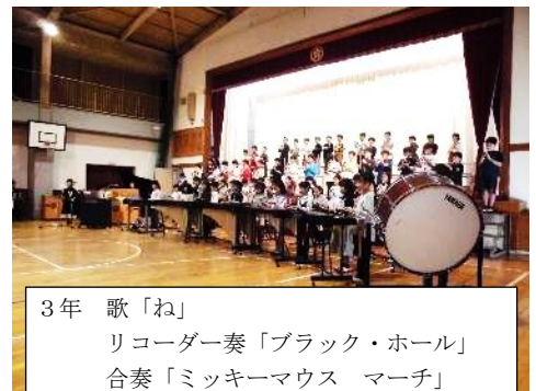
3年 歌「ね」 リコーダー奏「ブラック・ホール」 合奏「ミッキーマウス マーチ」