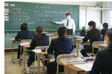
英語の岡崎先生 「入試の英作文対策」