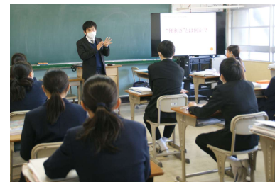
小論文の川本先生 「小論文の書き方とポイント」

12月2日(火)3年生を対象に, 呉三津田高等学校の先生3名に, 英語, 数学そして小論文の授業をしていただきました。高校の先生からは「とても活発な生徒さんですね。」「黙々と考えてしっかり書くことができているですね。」と褒めていただきました。生徒の方も「ポイントを教えてもらって入試対策にもなりました。」「話が面白かった。」「高校に入ってどういう勉強をするのか, どのように学んでいくのかかわかってよかった。」と, とても刺激になったようでした。ありがとうございました。