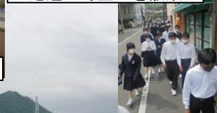
尾道の町並みを散策