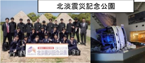
北淡震災記念公園