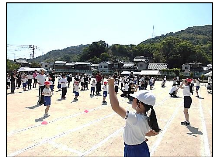
みんなで踊った「君くれハートダンス」

大きな怪我もなく、無事に運動会を終えることができましたのは、保護者の皆様が日頃から体調管理や水分補給の準備、そして温かい拍手と声援で子どもたちを支えてくださったお陰です。皆様の温かいご理解とご協力に、心より感謝申し上げます。本当にありがとうございました。