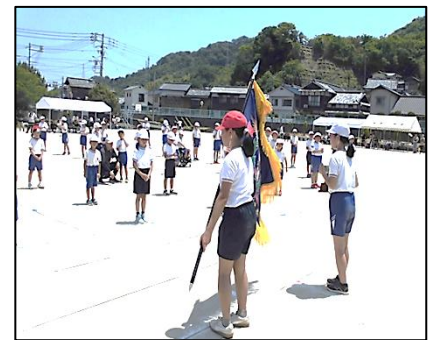
全力でやり切った赤組・白組団長