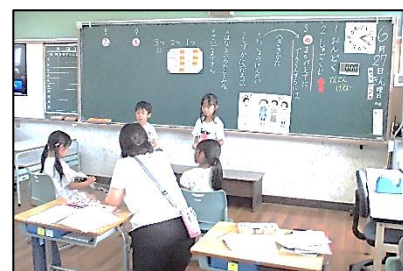
1年国語科「きいてつたえよう」