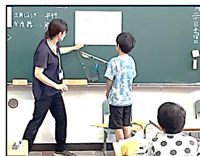
4年算数科「垂直・平行と四角形」

児童が、「分かった」「できた」「もっと学びたい」と思える授業を目指して全職員が一丸となって研修を続けてまいります。