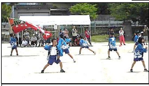
3・4年表現「太陽に吠えろ 音戸ソーラン」