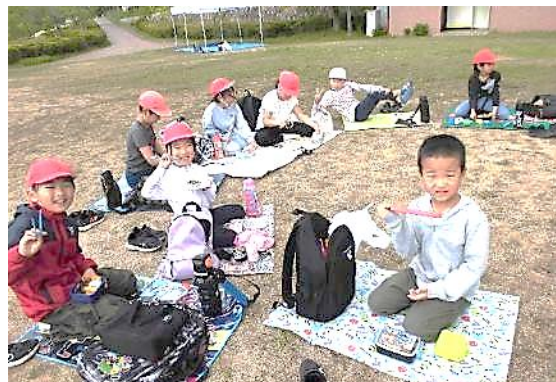
5月の全校遠足では、縦割り班活動を楽しみました