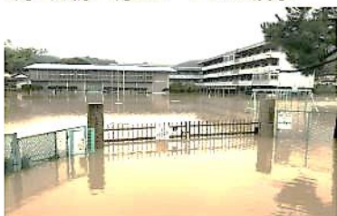
7月7日朝 約1メートルの浸水

音戸小の豪雨災害の被害や支援の様子を動画で観ました。改めて大雨・土砂災害の恐ろしさを実感しました。