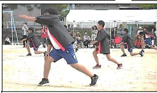
5・6年表現「ダンス音戸の舟唄」