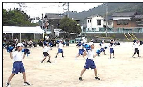
1・2年表現「アンダー・ザ・シー」