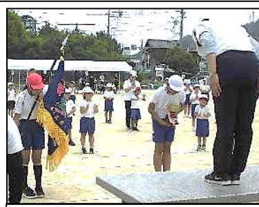
優勝旗・準優勝杯授与