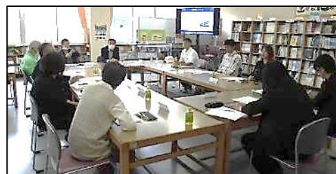
第2回学校運営協議会

第2回では、まず委員の皆様にご各クラスを授業参観していただきました。その後、各主任が学校の取組について説明し、質疑応答を行いました。委員の皆様から励ましのお言葉や貴重なご意見をいただくことができました。また、学校の教育活動をより充実させるために、地域でサポートしていただける方について情報交換し、協議することもできました。