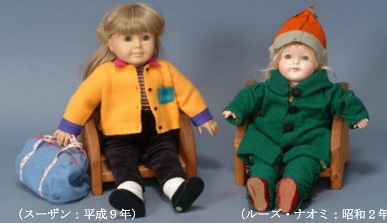
(スーザン：平成9年) (ルーズ・ナオミ：昭和2年) 平和と友情の使者「青い目の人形」