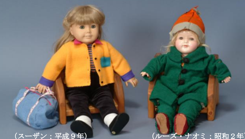
(スーザン：平成9年) (ルーズ・ナオミ：昭和2年) 平和と友情の使者「青い目の人形」