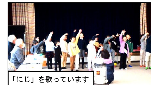
「にじ」を歌っています

本校の子供たちは、日頃から地域の皆様から大切にいただいています。おかげで郷土を愛する心が育ちつつあります。今後ともよろしくお願いいたします。