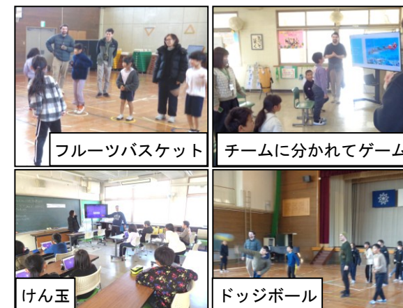
フルーツバスケット

子供たちは、アメリカやカナダ、フィリピンなどのお話を興味深く聞き、外国にも関心をもつことができました。