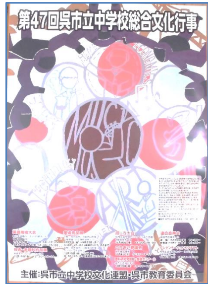
総合文化行事ポスター

今までの学習や活動の成果を一生懸命発揮することができるよう参加する生徒の皆さん、がんばりましょう!