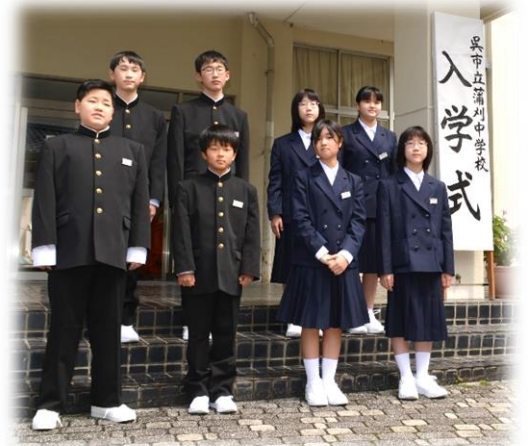
※個人情報保護のため取り扱いにご注意ください。

その結果、今年度の学級目標は「何事にもチャレンジし、みんなで協力し合っ、笑顔あふれるクラス」に決定しました。係の仕事や給食、掃除など、みんなで協力し合っている姿が多く見られます。今後も続けていき、笑顔で過ごせる教室を目指していきましょう！