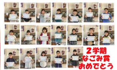
2学期 なごみ賞 おめでとう