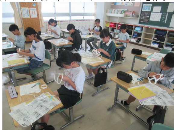
図工で、和紙のランプシャードの骨組みを作る