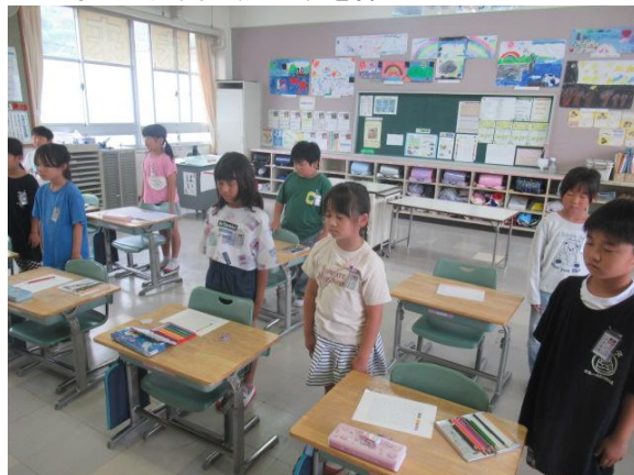
12時に1分間の黙とうを捧げました