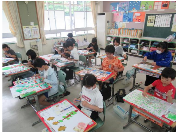
図工で、「木々を見つめて」を仕上げていました