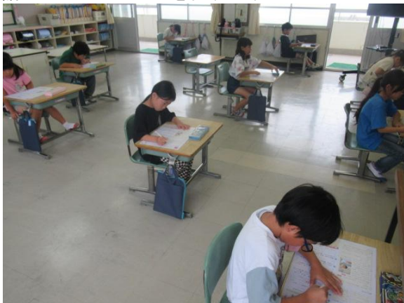
国語のたしかめテストを行う2年生