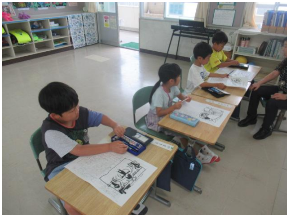
くらしの文集を書く1年生