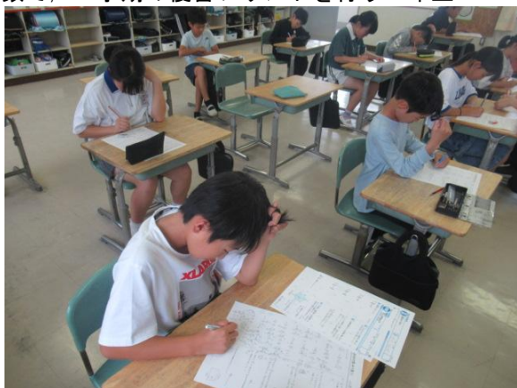
算数で、1学期の復習プリントを行う6年生