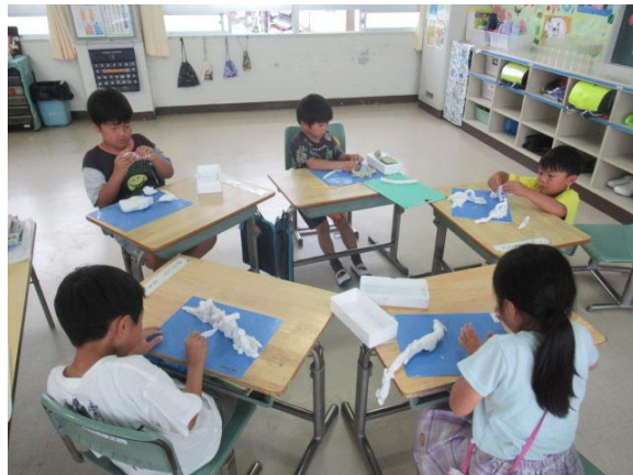
粘土で作品を作っていました