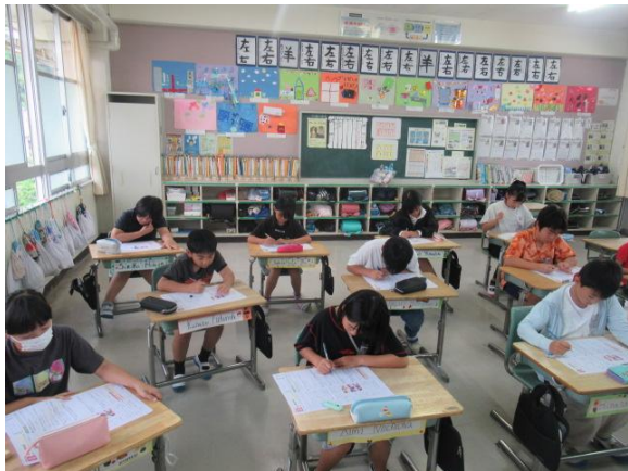
算数のまとめテストを行う4年生