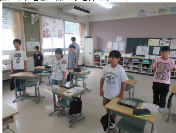
恒久平和を願い黙とうを捧げました