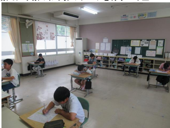
算数で、小数のわり算のテストを行う5年生