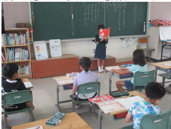
順序に気をつけて考えたことを発表していました