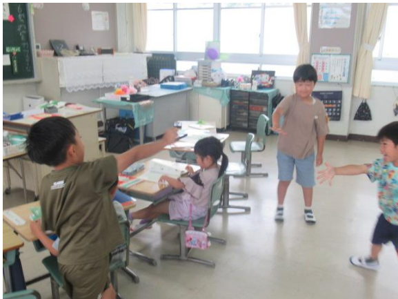
国語で、「大きなかぶ」の音読の役割を決める1年生