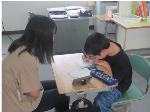
イラストを描いていたひまわり1組