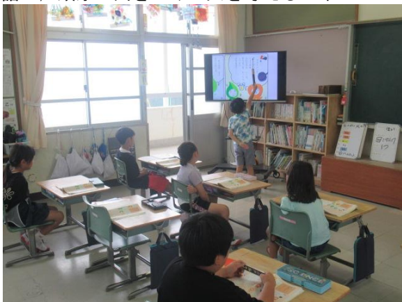
国語で、順序に気をつけて文を考える2年生