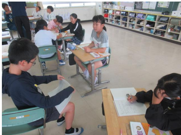
算数で、1万をこえる数を考える3年生