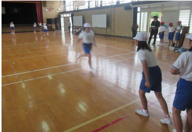
4年生もくれチャレンジマッチに挑戦していました