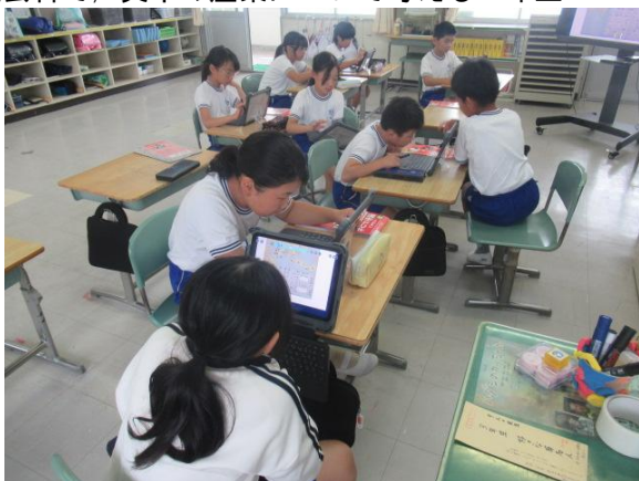
社会科で、呉市の産業について考える3年生