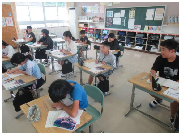
国語で、漢字の復習を行う6年生