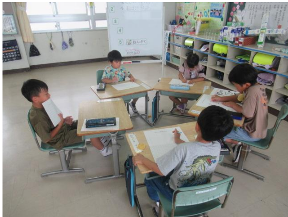
くらしの文集の題材を考えていました