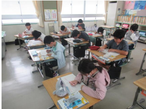
算数で、平行四辺形の書き方を学習していました