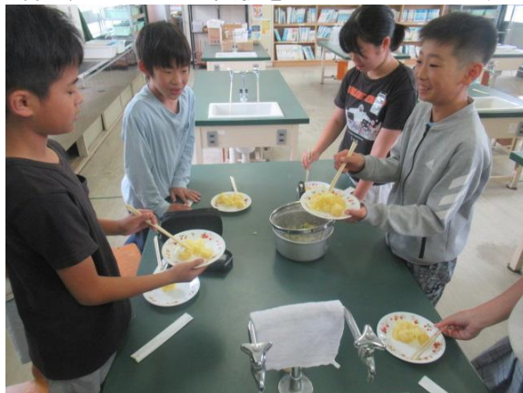
理科で、でんぷんの実験をしたジャガイモです