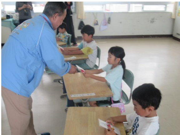
人権マスコットをプレゼントしてもらった1年生