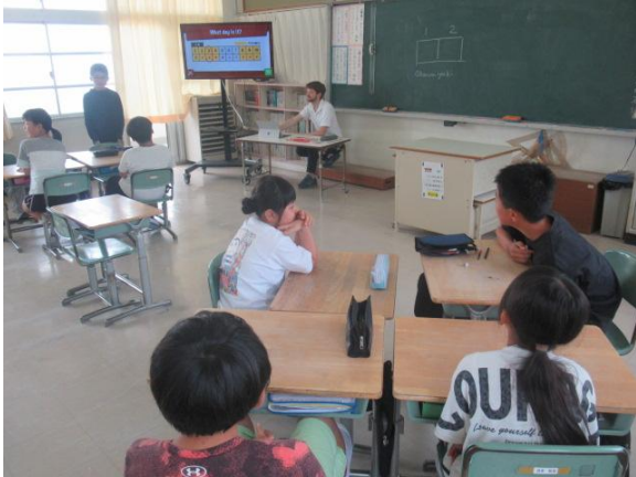
野外活動の疲れを見せず外国語の学習を行う5年生