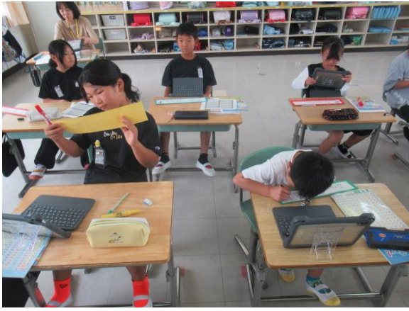
外国語活動で、ローマ字の名前を書く3年生