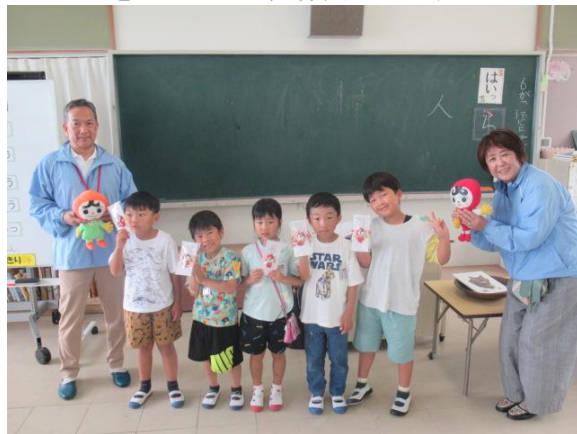
一人一人を大切に、仲良くします