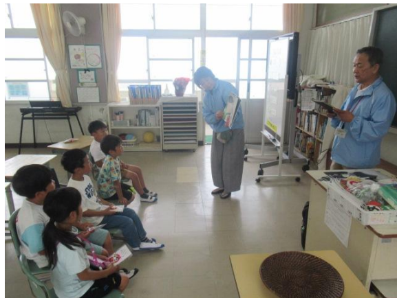
絵本の読み聞かせを行いました