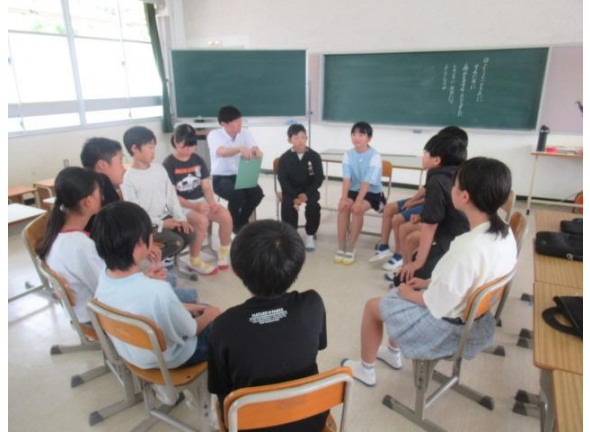
明日の研究授業に向けてサークル対話を行う6年生