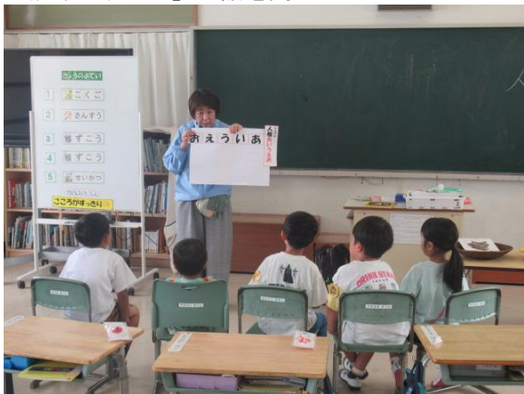
「人権あいうえお」の話を聞きました