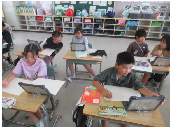
くらしの文集作文の下書きを書いていた