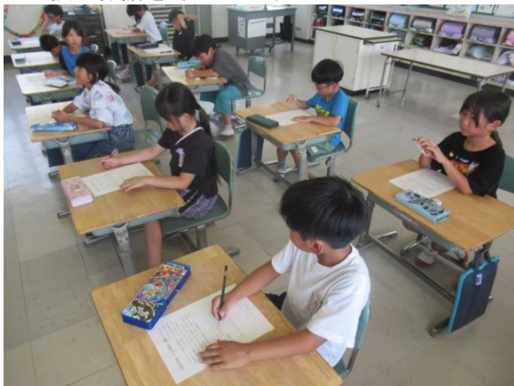
いじめ撲滅標語を考える2年生