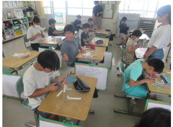
一人一人の良さをパズルのように組み合わせます