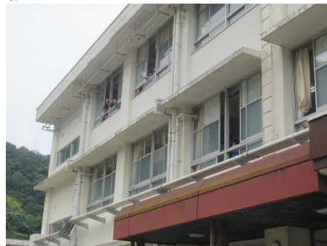
教室からもいつてらっしゃい！！