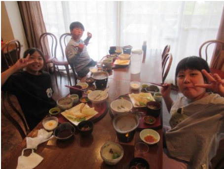
ごちそうさまでした