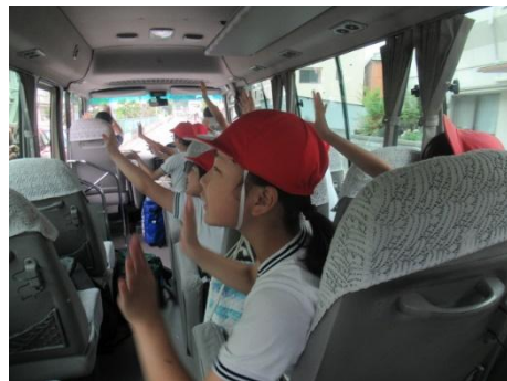
お見送り、ありがとう！！