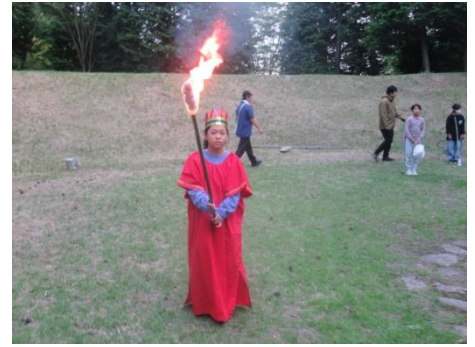
各班の出し物 盛り上がるぞ～！！