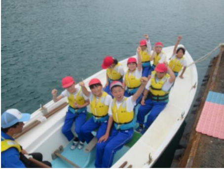
だいぶ上手くなりました」