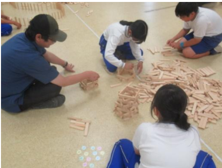
色々な形ができますね