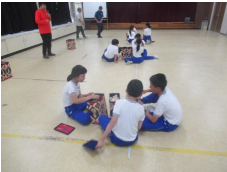
色々な形ができますね