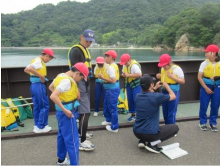
カッターに乗って、行ってきます