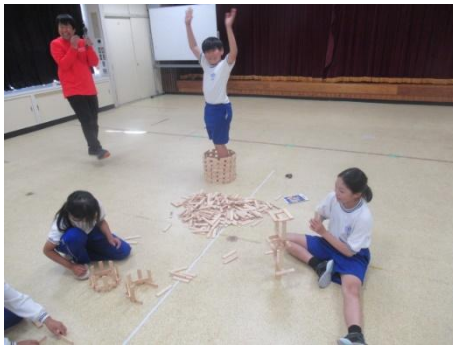
こんなの作りました