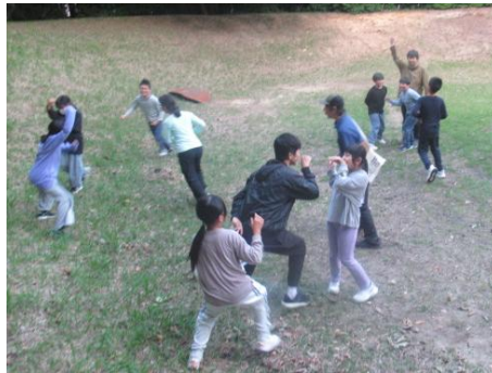
天使に進化したのは？