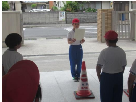
児童代表のあいさつ