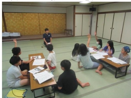
全員で1日の振り返りを行いました