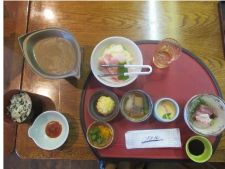
とても美味しいです