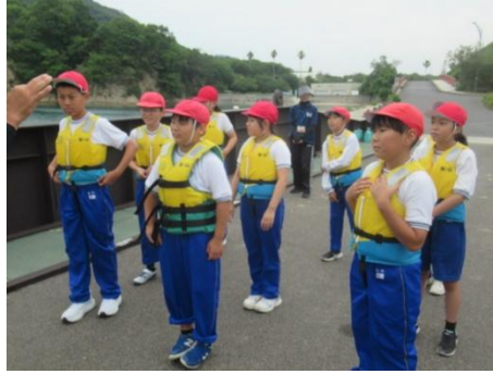
漕ぎ方を教えてもらいます」