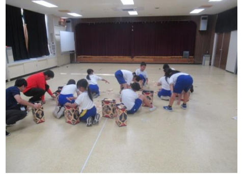
美味しくいただきます