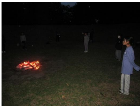
今日の日はさようなら♪