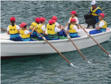
速く進んでいました