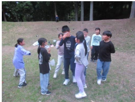
目隠し指示ゲーム