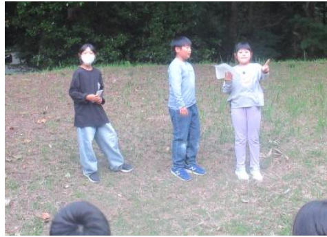
3班の出し物 古今東西ゲーム