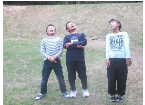
2班の出し物 クイズ大会