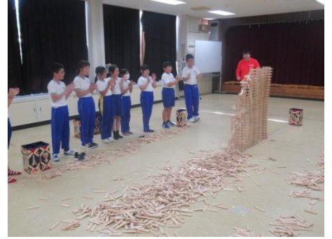
綺麗に片づけましょう