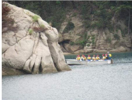
9人で力を合わせます