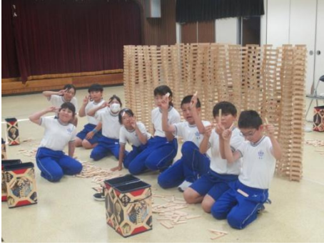
最後まで 最後まで