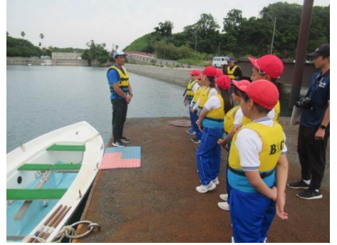
オーエス！ オーエス！