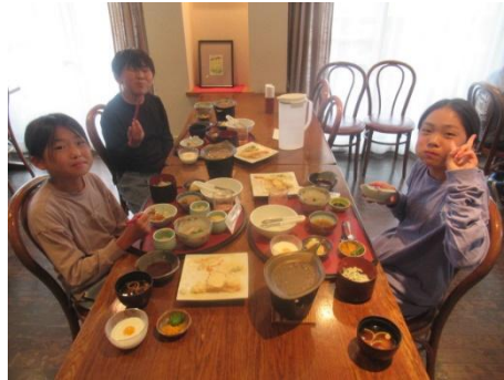
綺麗に片づけます