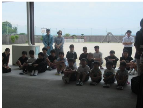
お見送りの児童や職員、保護者