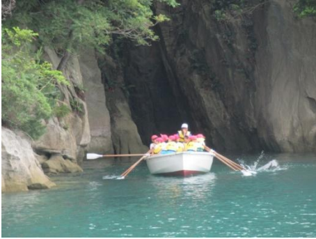
速く進んでいました