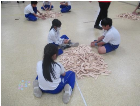
こんなの作りました