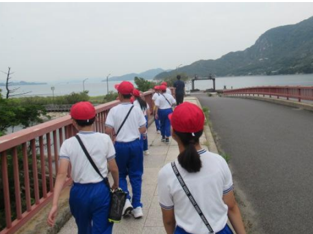
カッター訓練場へ