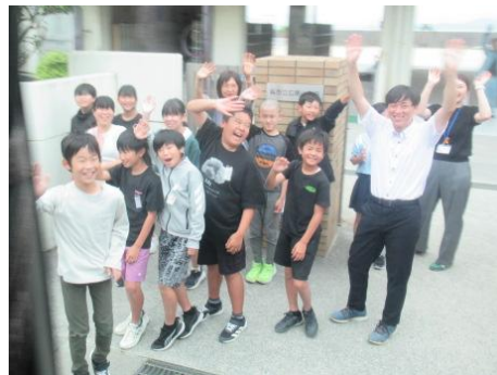
元気にいつてらっしゃーい！！