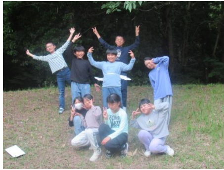
目隠し指示ゲーム