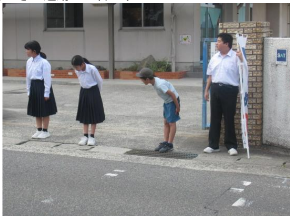
あいさつ運動2日目です