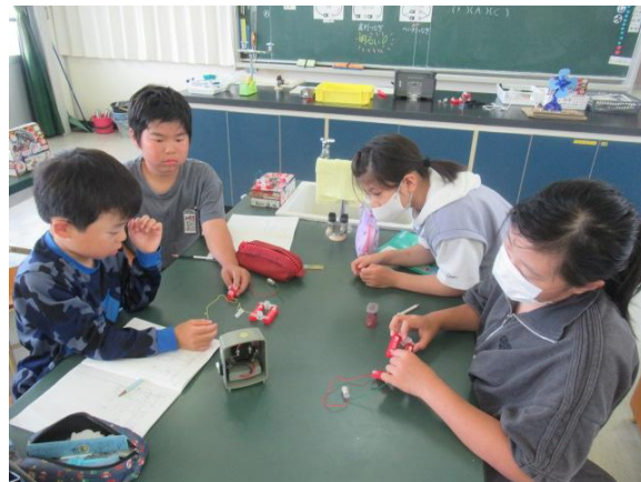
電球を明るくする方法を考えていました