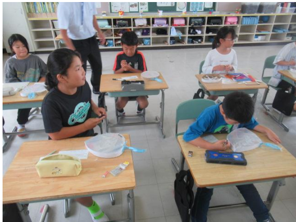
図工で、光のサンドウィッチを完成させた3年生