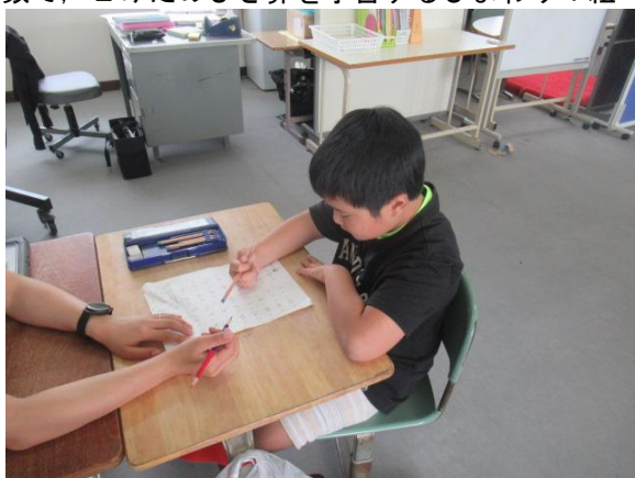
算数で、2けたのひき算を学習するひまわり1組