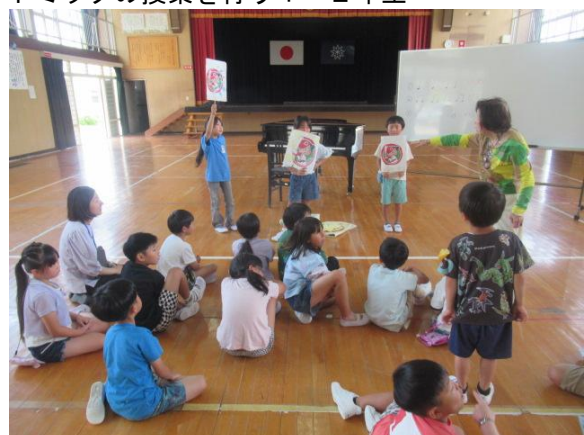
リトミックの授業を行う1・2年生