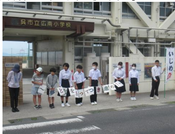
元気な声で「おはようございます！」