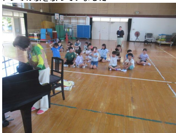
ドレミの歌を歌っていました