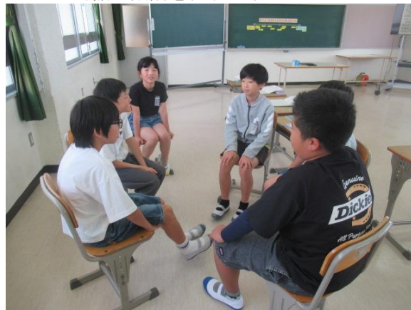
サークル対話で議論を行う6年生