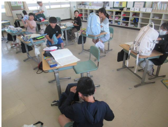
野外活動の荷物点検を行う5年生