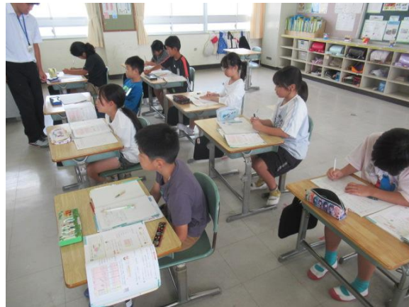
算数で、1万をこえる数の学習をしていました