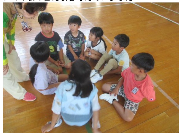
ドレミの歌の替え歌を考えていました