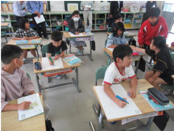
算数で、わり算のひっ算を学習する4年生