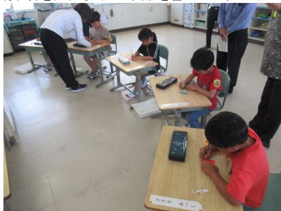
切れ目を入れるための図形を書いていました