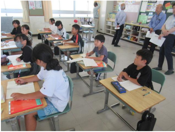
国語で、「自然のかくし絵」を学習する3年生