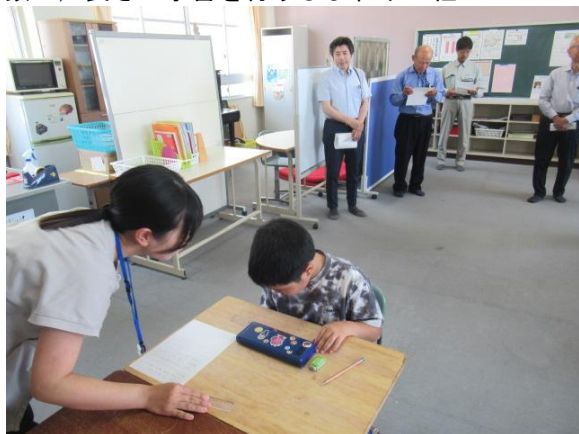
算数で、長さの学習を行うひまわり1組