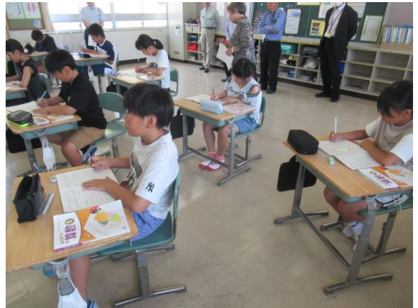
1より小さい数を×とどうなるか考えていました