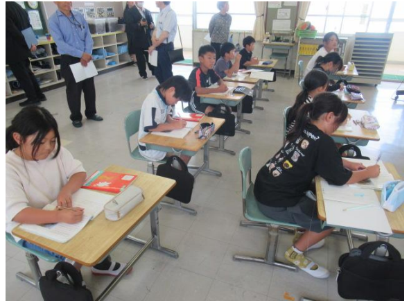
筆者が伝えたいことをまとめていました