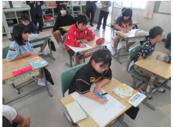
友達が作った問題を解いていました