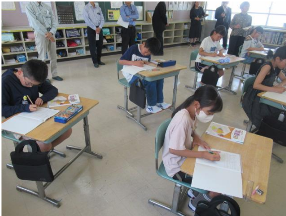
算数で、小数のかけ算を学習する5年生