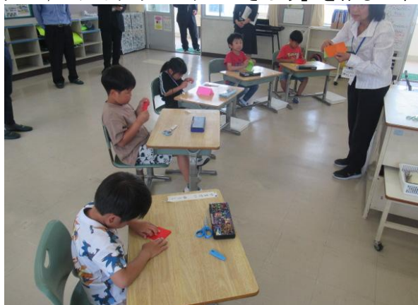
図工で、「チョッキンパツでかざろう」を作る1年生