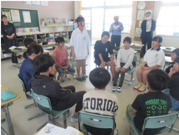
道徳で、友情について学習する6年生