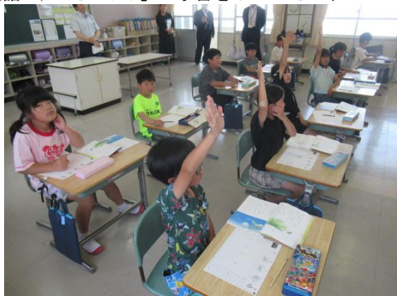
国語で、「たんぼぼ」の学習をしていた2年生