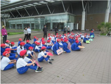
全員元気に歩きました