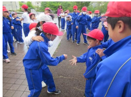
最後に勝ったのは？