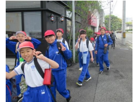
頑張って歩きました