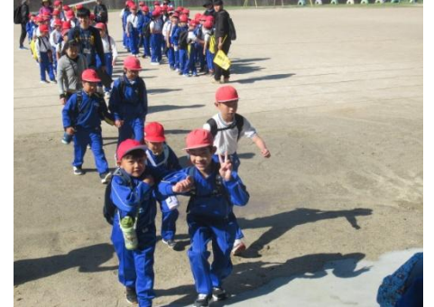
交通安全に気を付け広公園へ