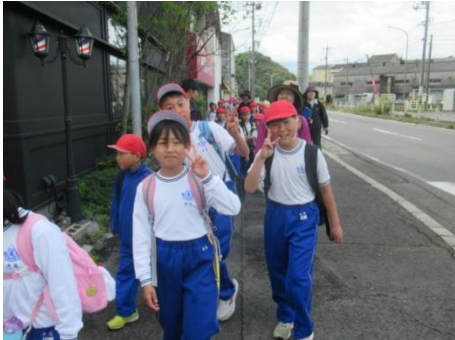
頑張って歩きました