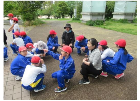
楽しみにしていました〜