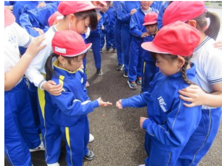
最後は、1年生対2年生