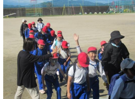
6年生と手をつなぐ1年生