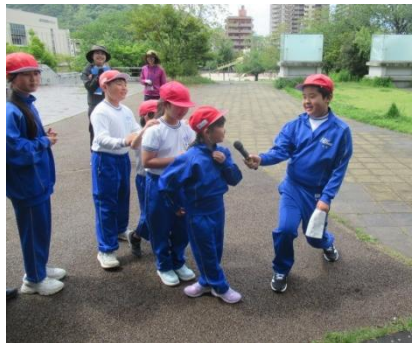
1回戦は2年生が優勝