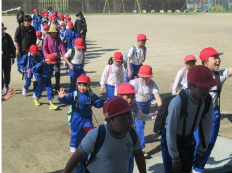
道中も元気でした