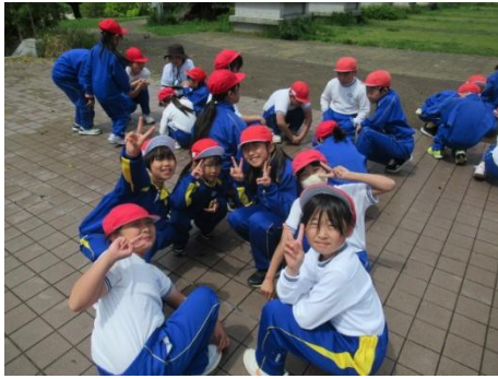
終わりの言葉 楽しかったですね