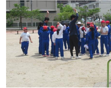
先生も一緒に楽しみましょう