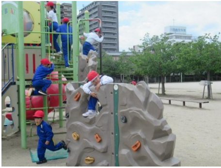
ゆらゆら楽しんでいました