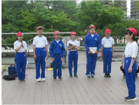
児童委員の進行で1年生迎える会