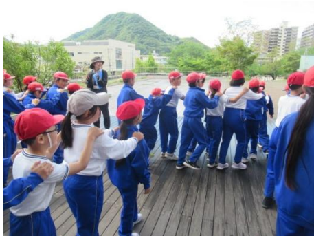
じゃんけん列車を行いました