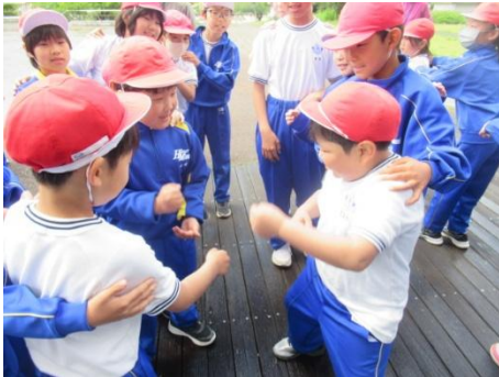
1年生が先頭でじゃんけん