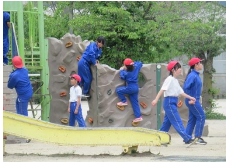
先生と鬼ごっこする人 よっといで