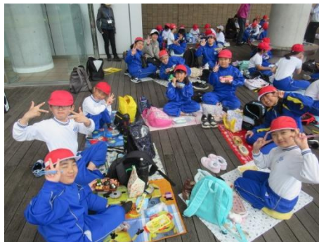
おなか一杯になりました