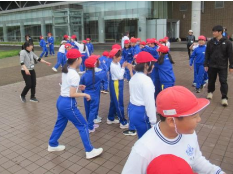
猛獣狩りに行こうよ！！