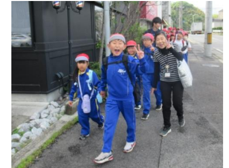
6年生と手をつなぐ1年生