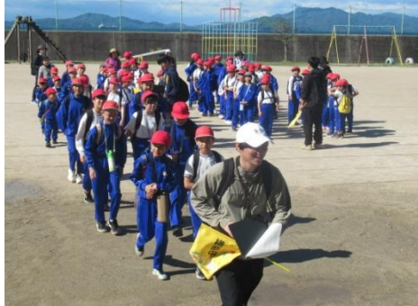
いってらっしゃーい！！