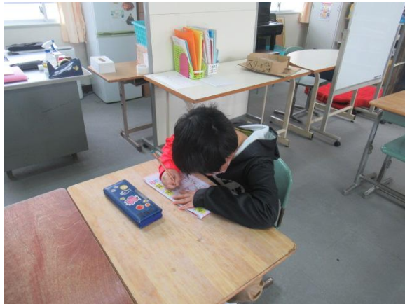
新出漢字の練習をしていたひまわり1組