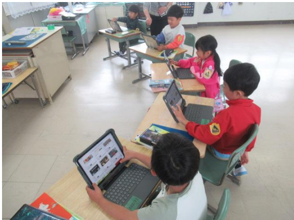
初めてタブレットを使う1年生