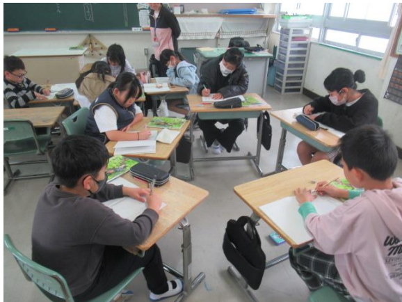
国語で、物語文の要約を行う4年生