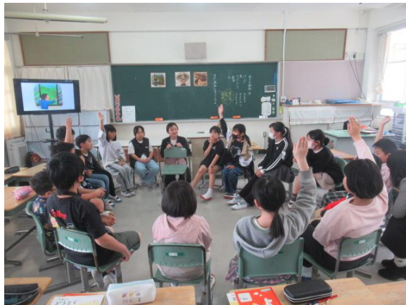
道徳で、自然の大切さを話合っていました