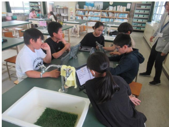
理科で、気象に関するクイズを考えていました