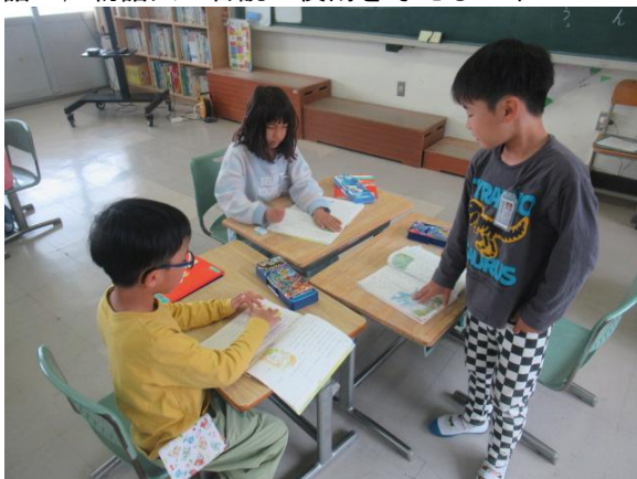
国語で、物語文の音読の役割を考える2年生