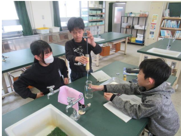
燃焼前と燃焼後の気体の成分を調べていました