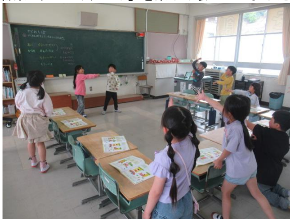
音楽で、「かくれんぼ」を楽しく歌っていました