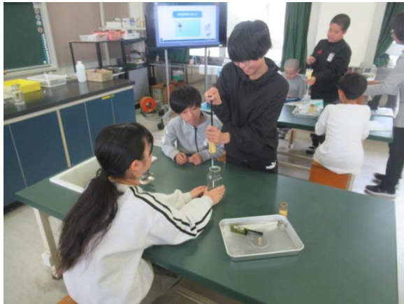
理科で、気体検知器を使って実験を行う6年生