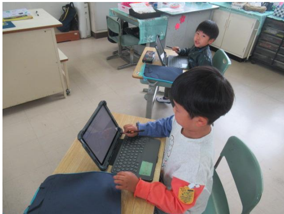
早速、キュビナドリルを行っていました