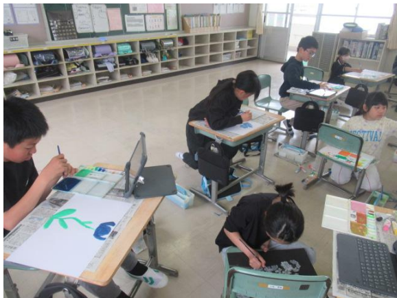
図工で、春の花を描いていた5年生