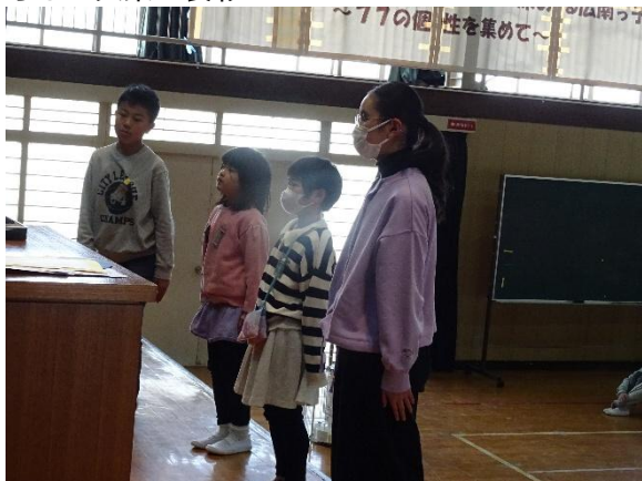
くらしの文集の表彰