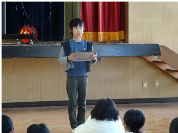
2学期の振り返りを発表する5年生 野外活動での学び