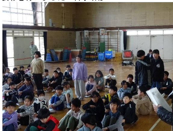
表彰を行いました 科学研修