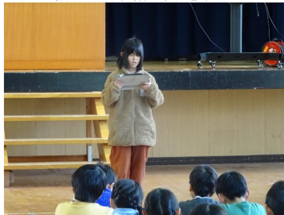
3年生の振り返り 国語の学習を頑張りました