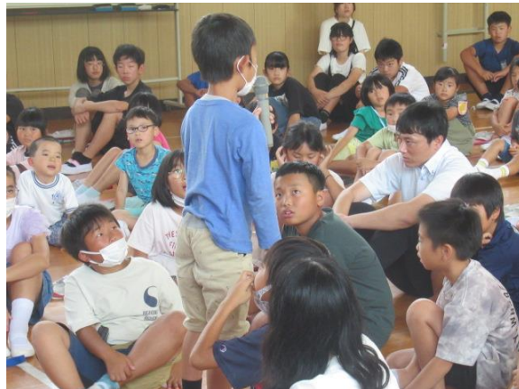
決まりを守り、楽しい夏休みを過ごしたいです