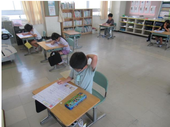
算数のテストを行っていた2年生