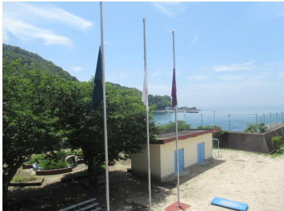
豪雨災害犠牲者の方々への弔意を表す半旗の掲揚