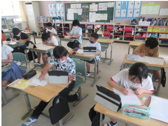
算数で、1学期の練習プリントを行う5年生