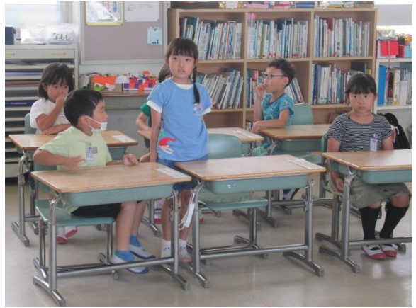
自分の意見をしっかり発表していました