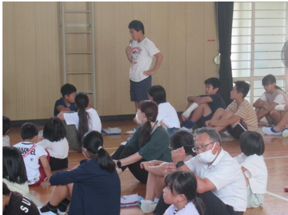
学んだ事を生かして安全に生活したいと感想を述べる