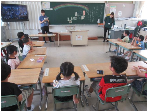
楽しく道徳を学習していた1年生