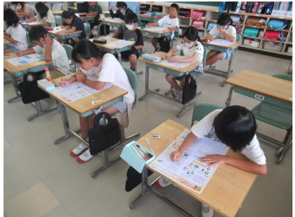
理科の電気のはたらきのテストを行う4年生