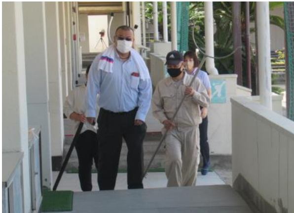
不審者が侵入した時の職員の対応を練習しました