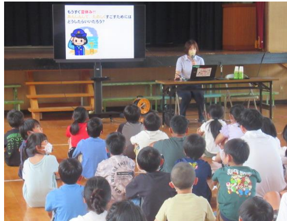
安全に生活をするための決まりなどを学びました