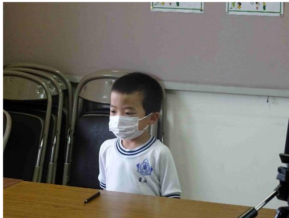
5月の生活目標のふり返りを発表する1年生