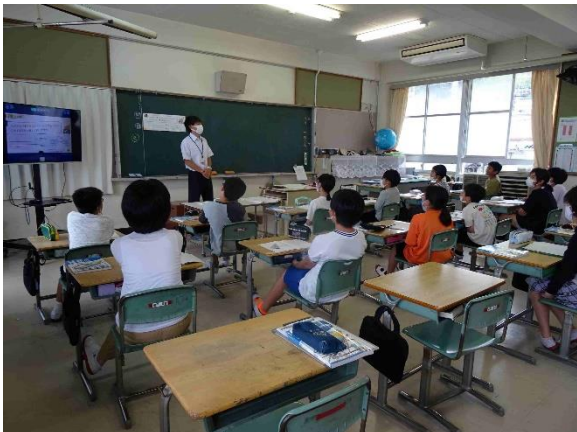
中学の先生が算数の乗り入れ授業を行う5年生