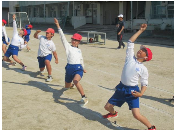
気合が入っています