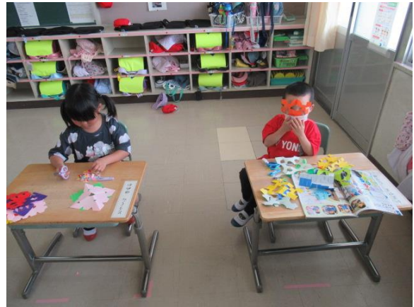
お面にしていました