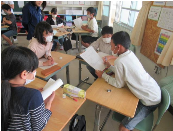
総合で、地域について考える6年生