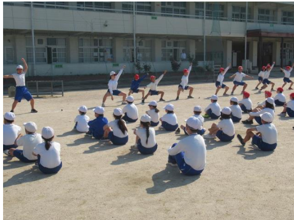
動きがかっこいいです