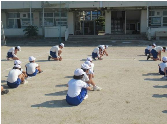
体育朝会で、6年生がソーランを踊りました