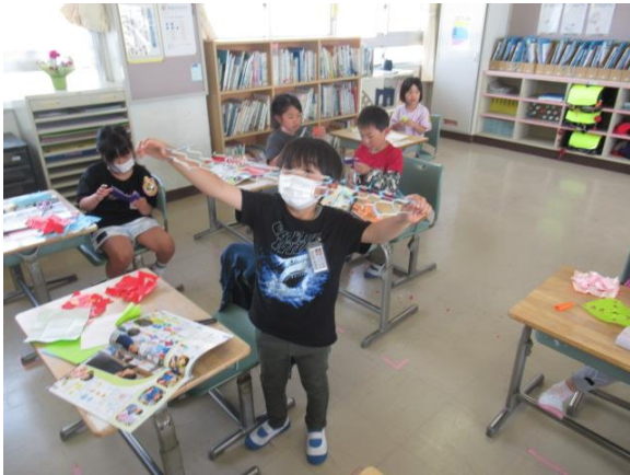
図工で、楽しく作品を作る1年生