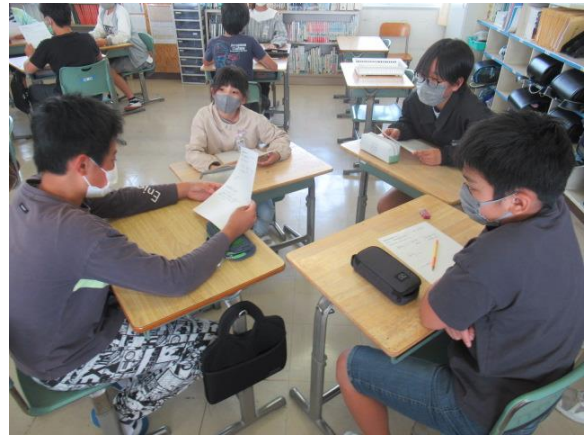
いつも活発に話し合っています