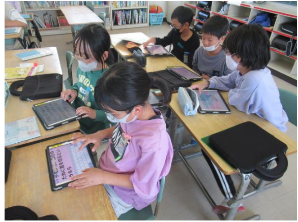
友達の考えを聞きながら自分の考えを検討