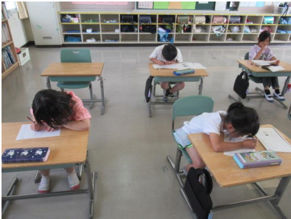
集中して国語の学習を行う2年生