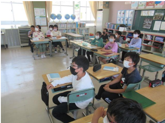
道徳で、友情について考える5年生