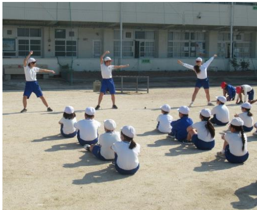
今年は声を出します