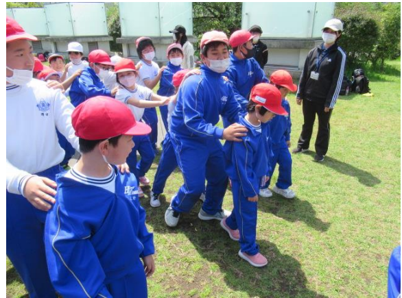
1年生を先頭にじゃんけん列車行いました