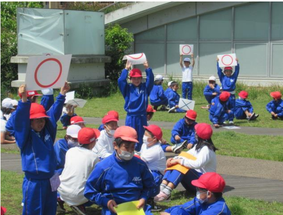
担任の先生の好きな色は青 〇で～す 正解