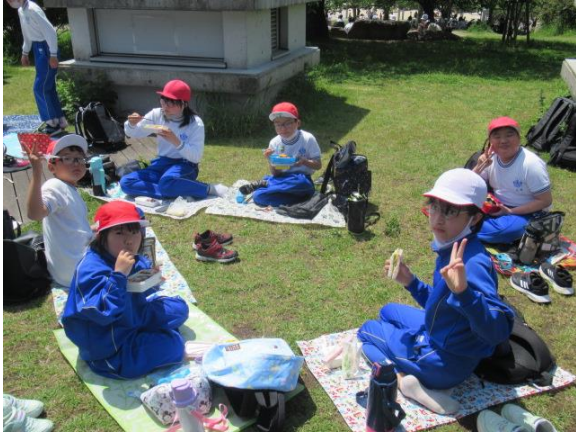
お待ちかねのお弁当の時間です