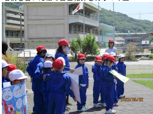
名前を書いた絵で自己紹介を行う1年生