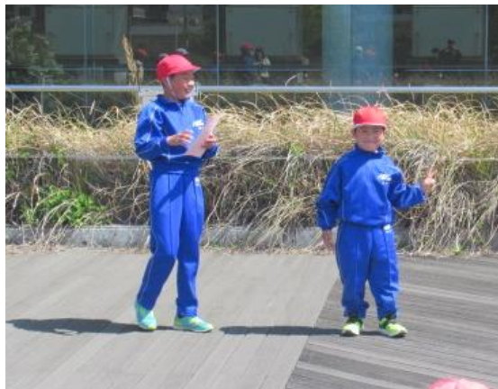
名前を呼ばれて決めポーズをしていました