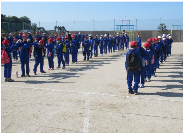
出発式を行いました