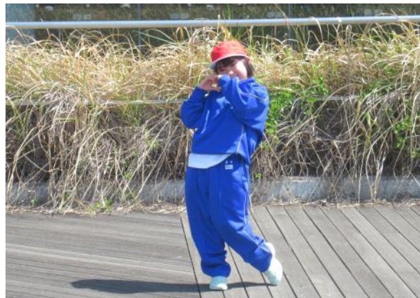
可愛いポーズをしていました