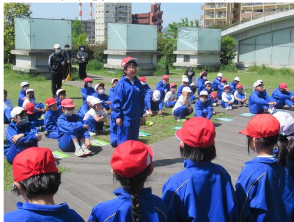
はじめての言葉を言う5年生の児童委員