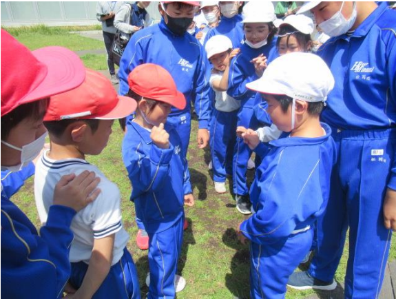
決勝戦です 最初はグー じゃんけんポン