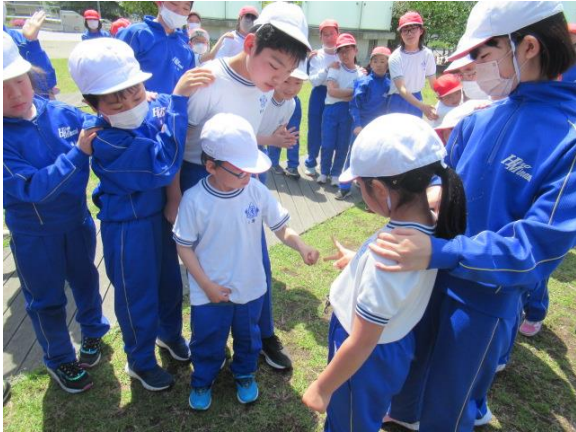
決勝戦です グーの勝ち