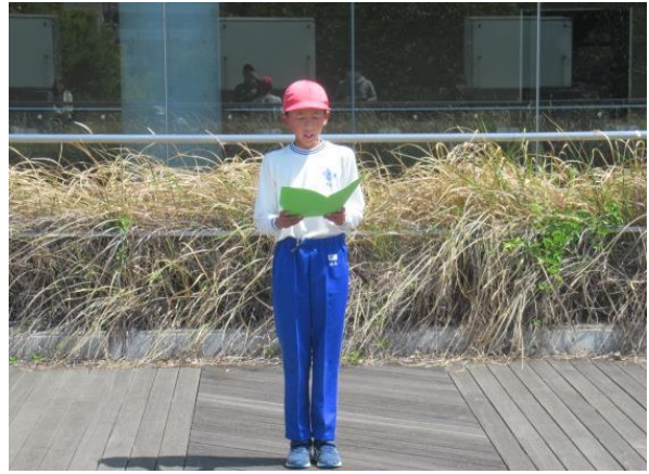
1年生に関する〇×クイズの説明