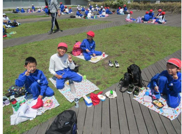
みんな笑顔で、楽しそう