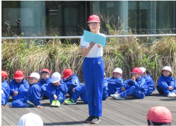
児童委員の進行で、1年生迎える会がスタート