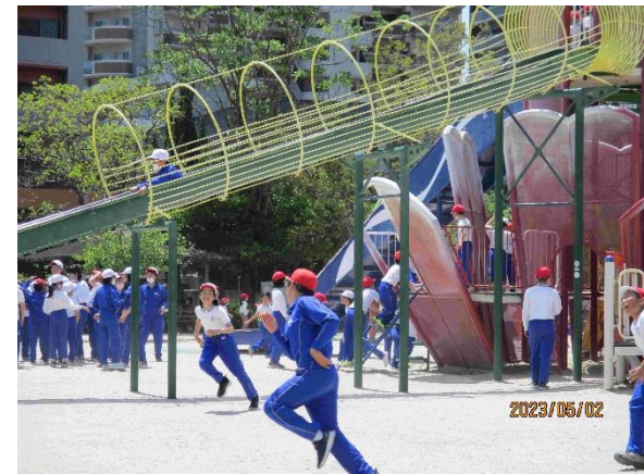
学校到着 楽しい遠足になりました