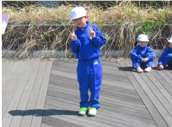
ポーズを取りながら1年生の入場