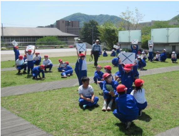
1年生が〇×のボードを挙げます