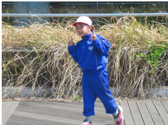
1年生の名前を早く覚えてくださいね