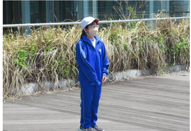
1年生さん楽しかったですか？「は〜い」