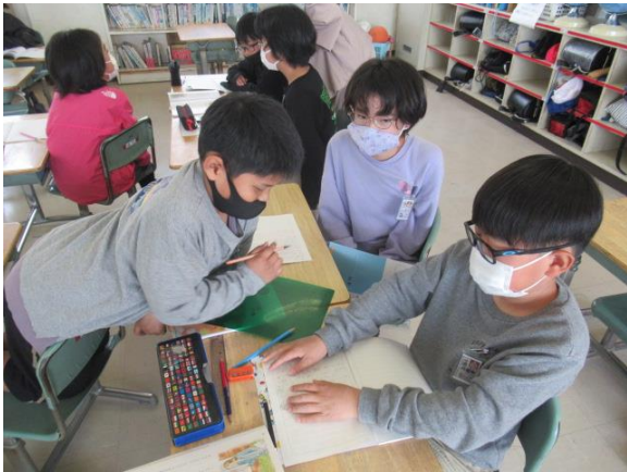
道徳で、グループ交流を意欲的に行う5年生