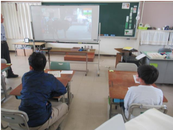
ビデオを見ながら学習するひまわり2組