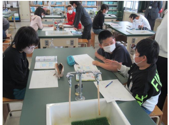
実験結果から分かったことを交流していました