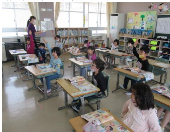
道徳で、意欲的に発表する1年生