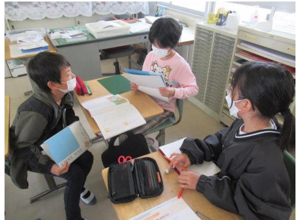
友達の考えを聞いて自分の考えを深めていました