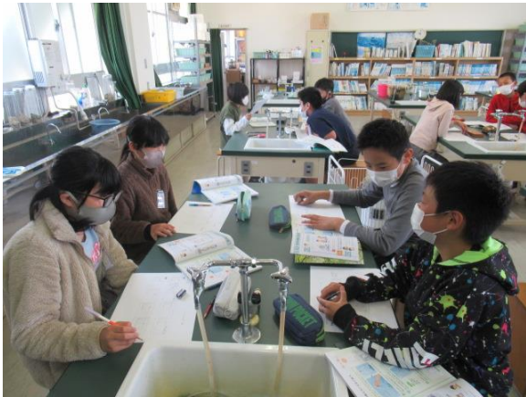
理科で、物の燃え方の学習を行う6年生