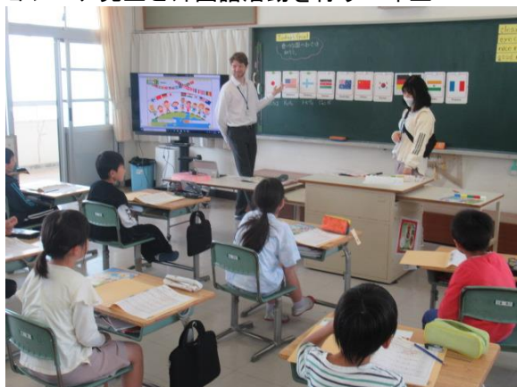
ジョシュア先生と外国語活動を行う3年生