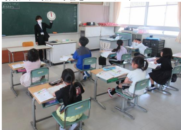
算数で、時計の学習をしていた2年生