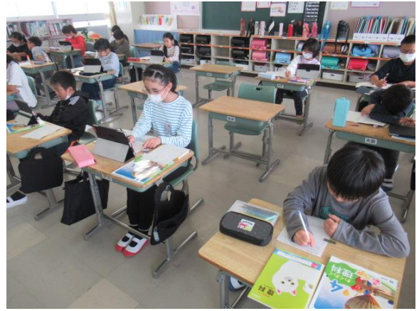
観察したことをまとめていました