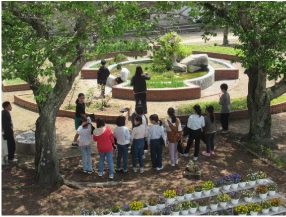
理科で、春の生物を観察する4年生