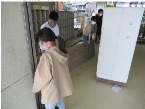
下足場を綺麗に掃除していました