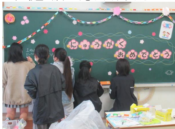
1年生教室の飾りつけをしぐくれました