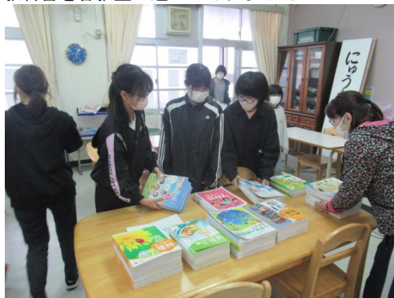
教科書を各教室に運んでくれました