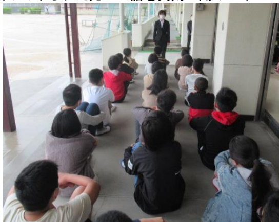
新しく来られた先生の話真剣に聞く6年生