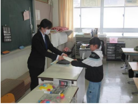
担任からのメッセージ 3年生