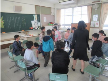
友達のあゆみが気になりますね