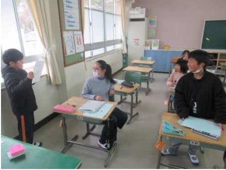
担任からのメッセージ