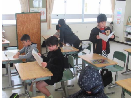
修了証書を受け取る4年生