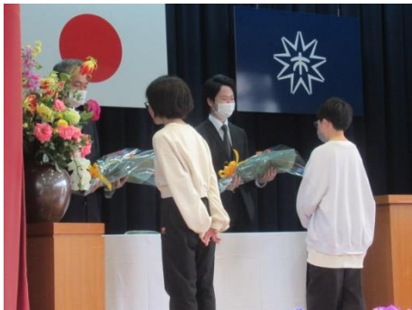
出会った時には声をかけてください