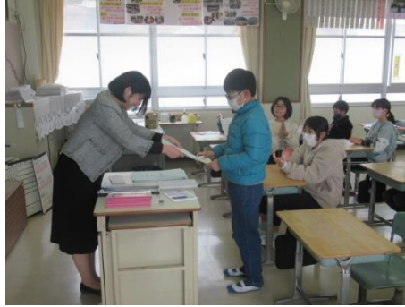
1年間を振り返るひまわり2組