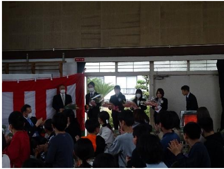
1年間の成長を振り返っていました