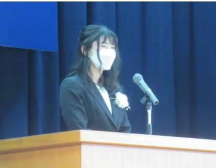
ありがとうの言葉を大切にしてください