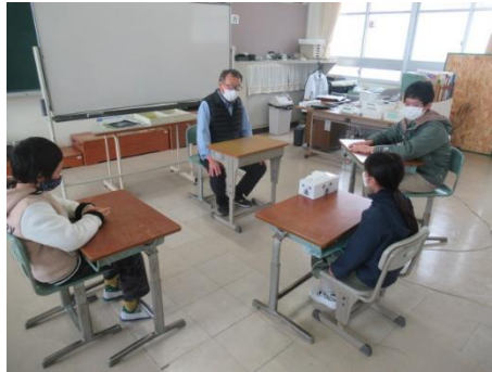
1年間を振り返るひまわり2組