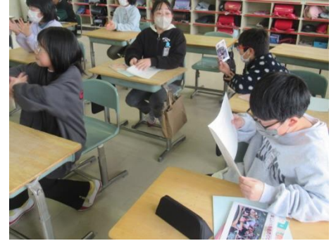
絵本を讀んでいたひまわり1組