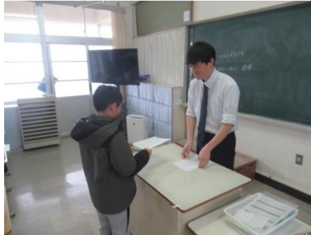
修了証書を受け取る5年生