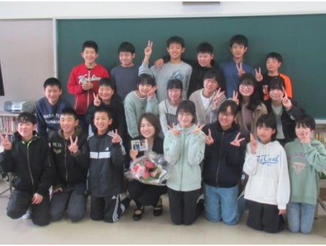
1年間の思い出を話していました