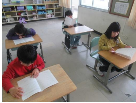
あゆみは、良かったですか？