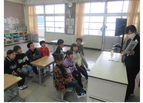
担任から一人一人に手紙