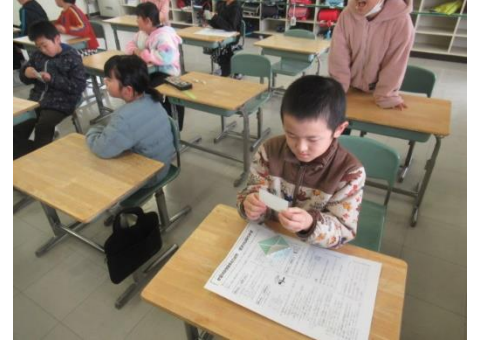
あゆみをじっくり見ていました