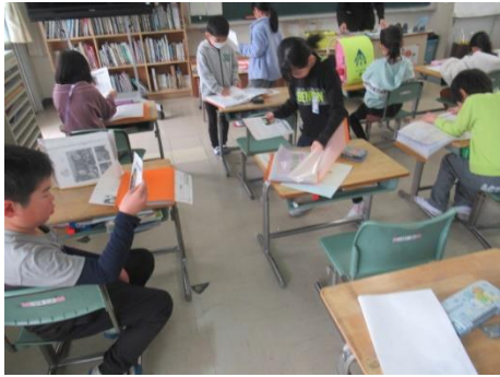
1年間の成長を振り返っていました