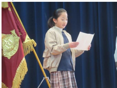
離任される先生方