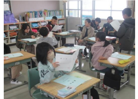
成績あがったかな？