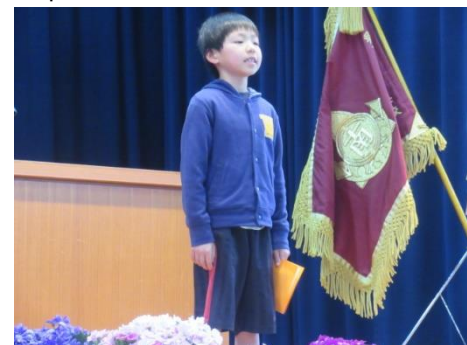
送別式を行いました