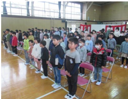
代表児童が1年間の振り返り