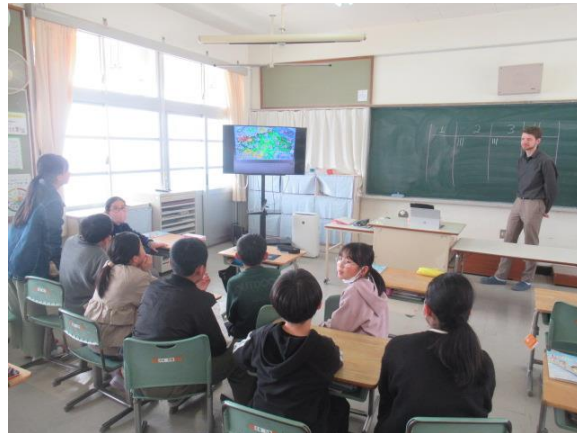
外国語活動のゲームで盛り上がる4年生