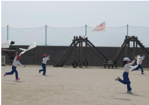
凧あげを楽しむ1年生