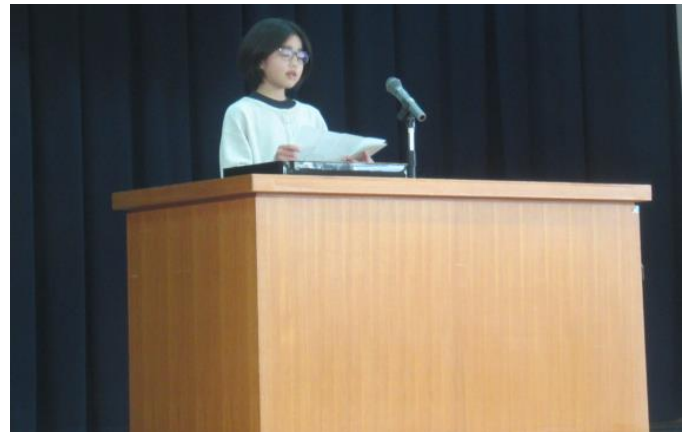
卒業式の予行練習 在校生送辞