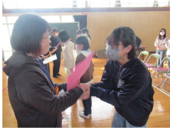
中学校でも頑張って ありがとうございます