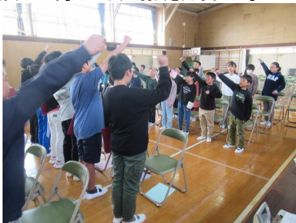
「ありがとう」ソング、「勇気を出そう！！」