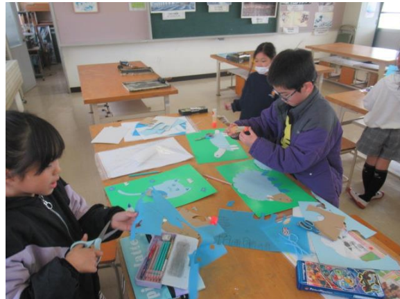
紙版画の下絵が仕上がってきた2年生