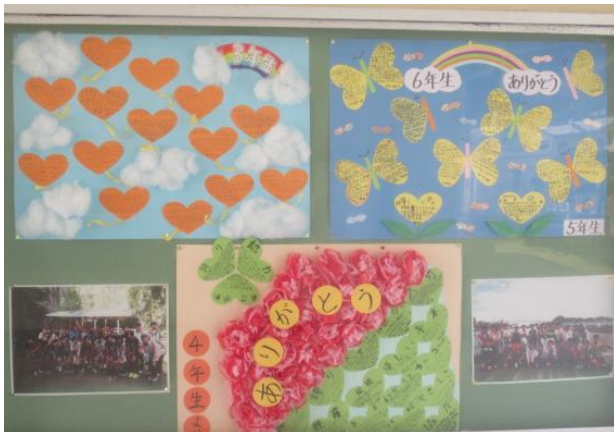
在校生の感謝の言葉があふれています