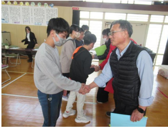
6年生から先生方へ感謝のプレゼント