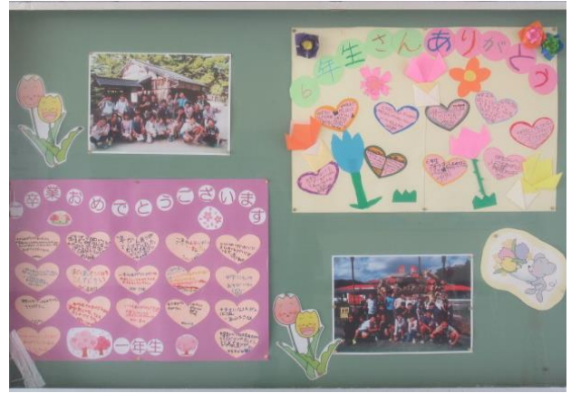
6年生ありがとうの掲示板