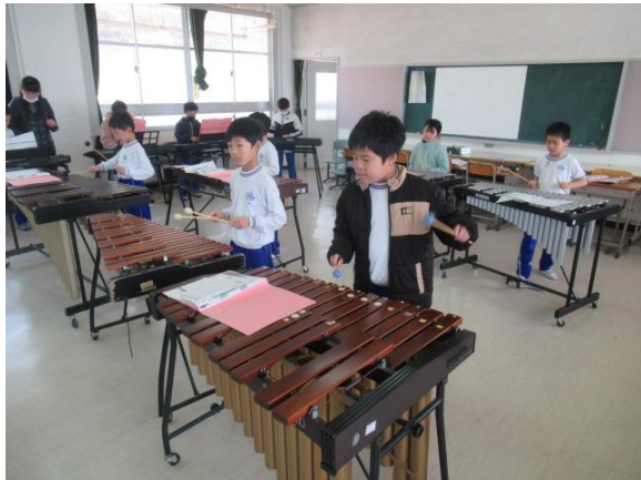
合奏が上手になっていた3年生