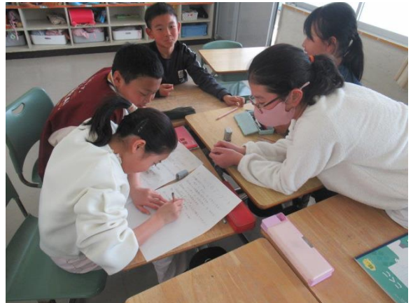
国語で、本についてのアンケートを考える4年生