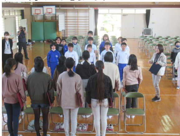
「ありがとう」ソングを歌います