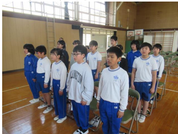
仰げば尊し 2番は在校生