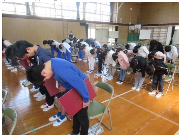
卒業式の練習を行いました