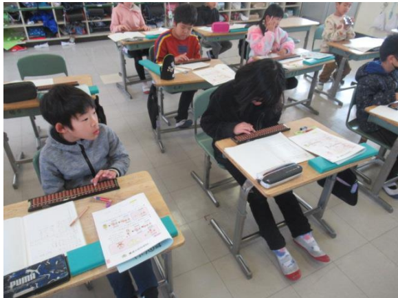
算数で、そろばんの学習をしていた3年生