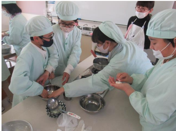
家庭科で、白玉団子を作る5年生