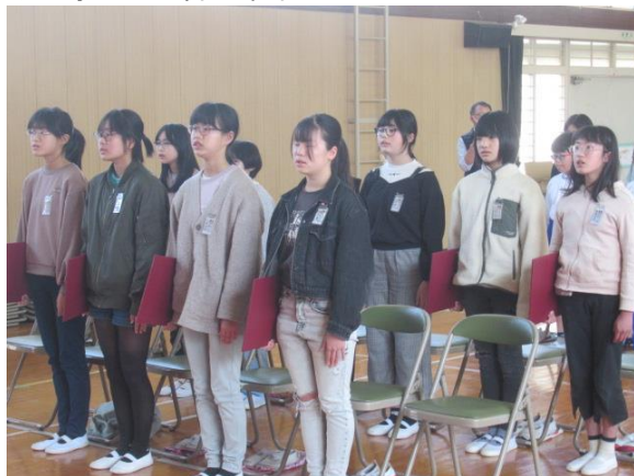
仰げば尊し 1番は卒業生