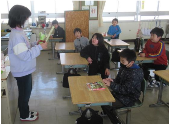
図書委員が、各学年の読書王を表彰しました