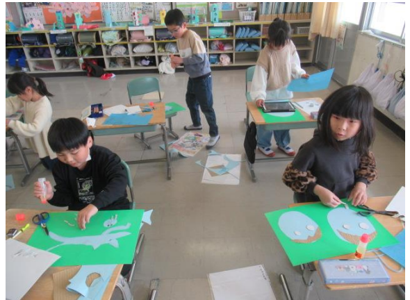
図工で、紙版画を作っていた2年生