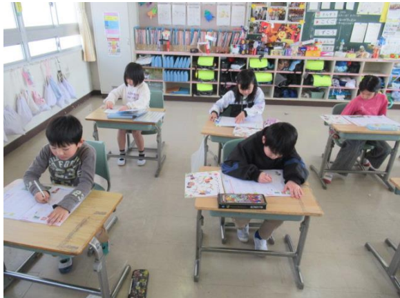
書写を行っていた1年生