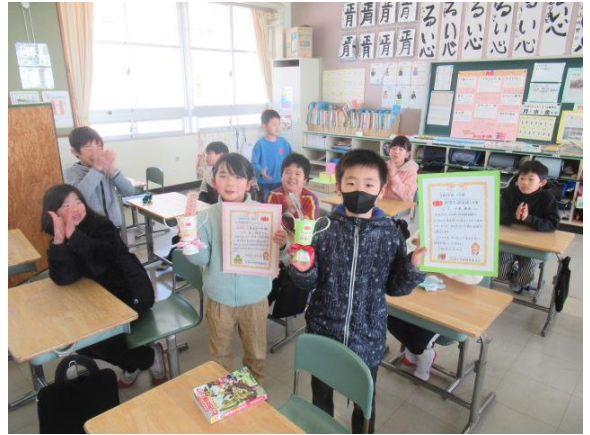
3年生が、年間読書チャンピオンになりました