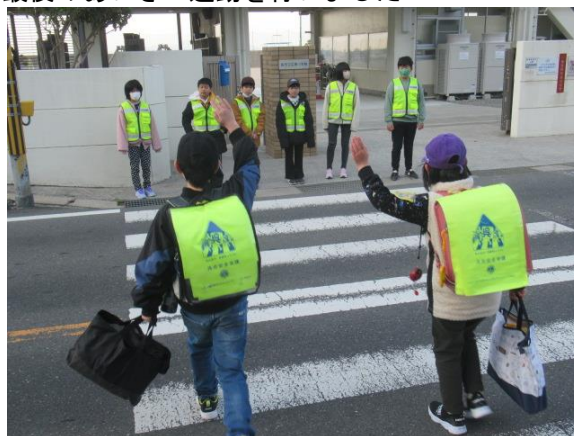
最後のあいさつ運動を行いました