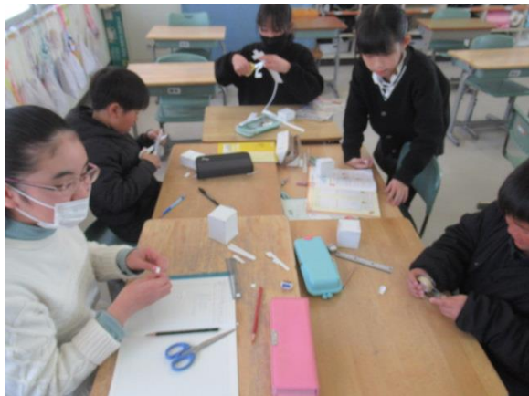
算数で、立方体を作っていた4年生