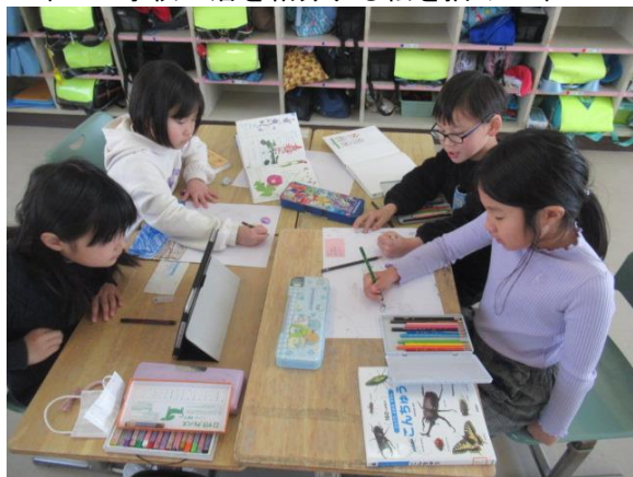
新1年生に学校生活を介绍する絵を描く1年生