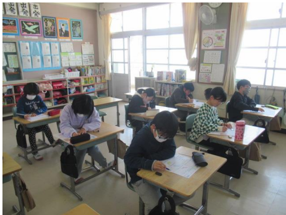
算数の学年まとめテストを行う5年生