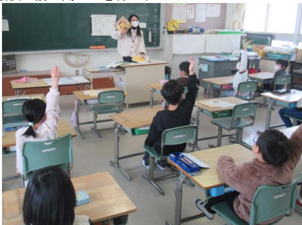
最後の読み聞かせを行いました