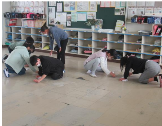
6年生は、最後の大きな掃除です 立つ鳥後を濁さず