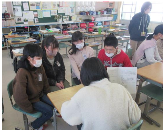
社会科で日本とつながりの深い国の紹介を行う6年生