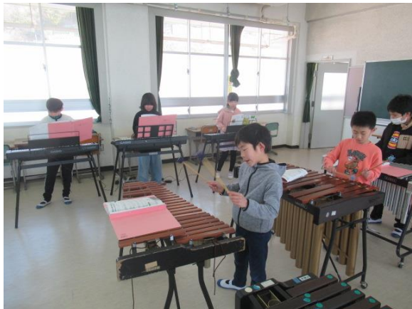
「パフ」の演奏を行っていた3年生