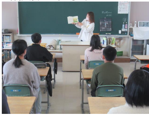
1年間、ありがとうございました