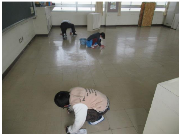
一生懸命大掃除を行うひまわり2組