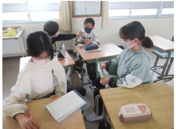
道徳で、本当の自由について話し合っていました