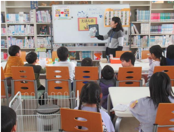
学校司書さんのえほん会にたくさん参加していました