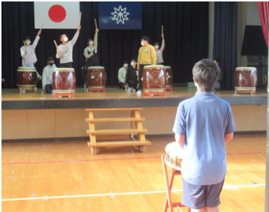
龍神太鼓の練習を行う6年生