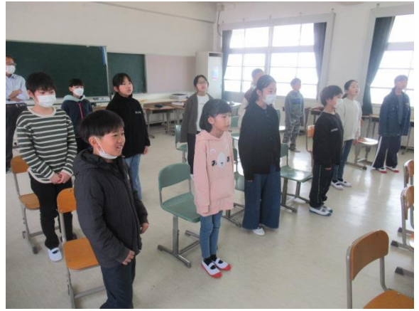
音楽で、呉市歌を練習していた4年生