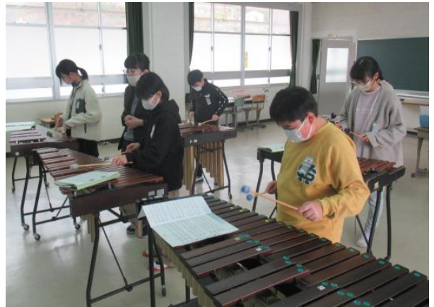
音楽で、合奏の練習をしていました