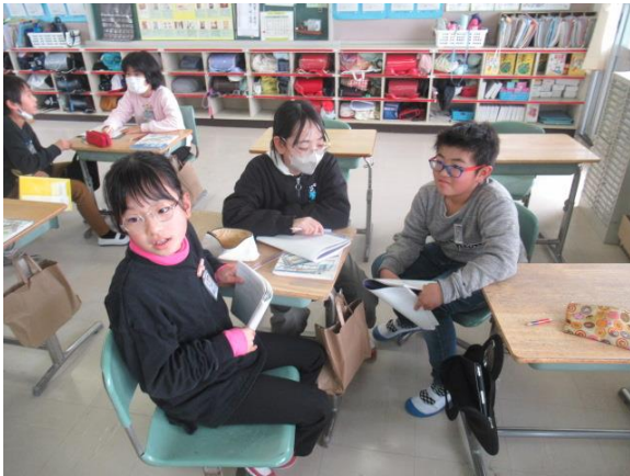
算数で、円柱と角柱の違いを考える5年生