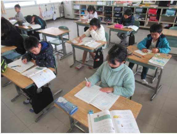
二けたのかけ算の問題を一生懸命行う3年生