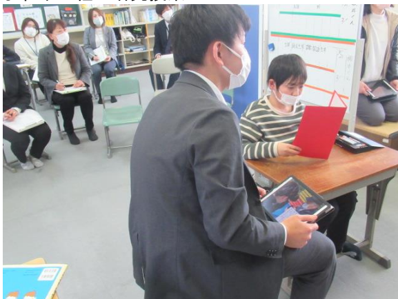
ひまわり1組の研究授業

ひまわり1組が、道徳の研究授業を行いました。在籍児童の1名が欠席したため、1名だけの授業でした。業務主事の先生を教材にして、学校生活の様々な場面で支えられていることに気付き、感謝の気持ちを育てる授業でした。仕事をしていて「ありがとう」の言葉が一番うれしいということから、「ありがとう」を言いたいと考えていました。