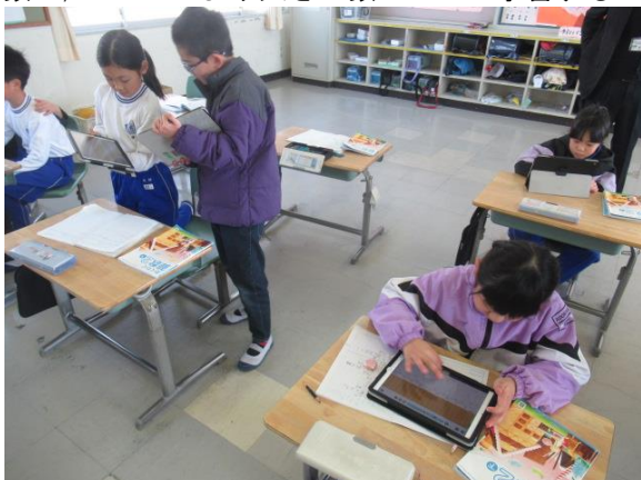
算数で、1000より大きい数について学習する2年生