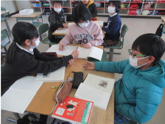
説明文を序論・本論・結論に分け、要旨を考える5年生