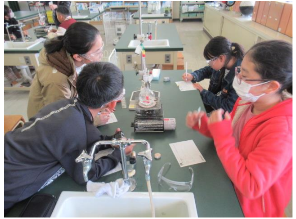
水の温度は、何度まで上がるのでしょうか？