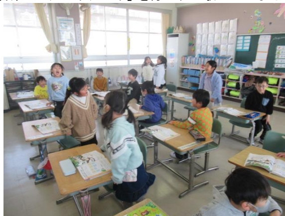
音楽で「アーイー」を分かれて歌っていました