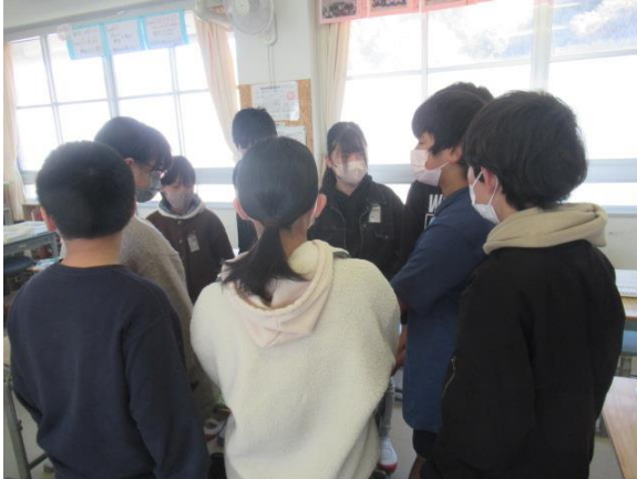
算数で、図を使って考える問題について協議する6年生