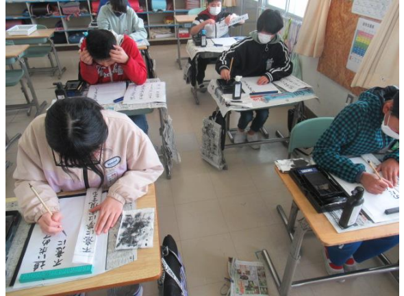
小筆を使って、文章を丁寧に書いていました