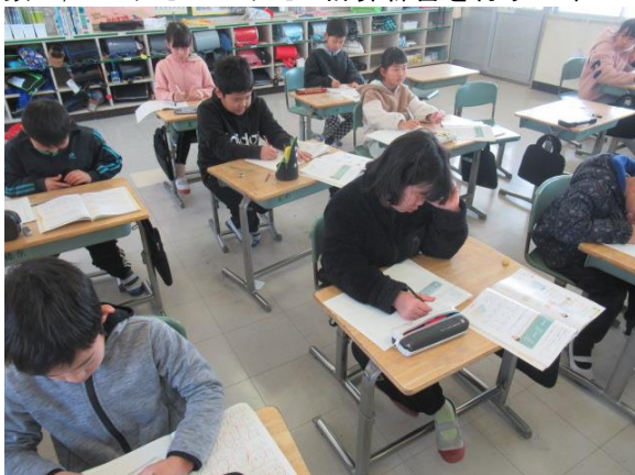
算数で、二けた×二けたの計算練習を行う3年生