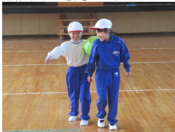
体育で、ボール遊びをしていました