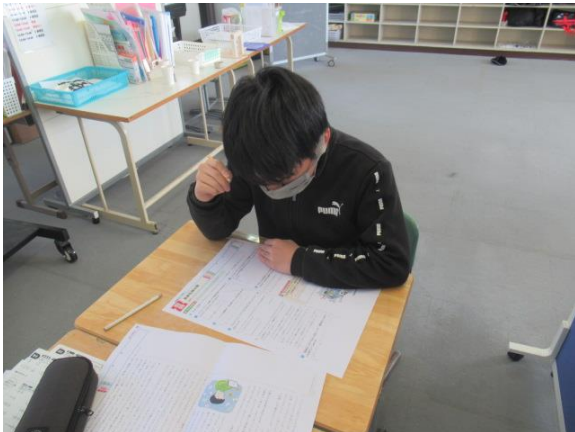
国語のテストを行うひまわり1組