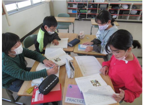
グループで、協議しながらしっかり考えていました