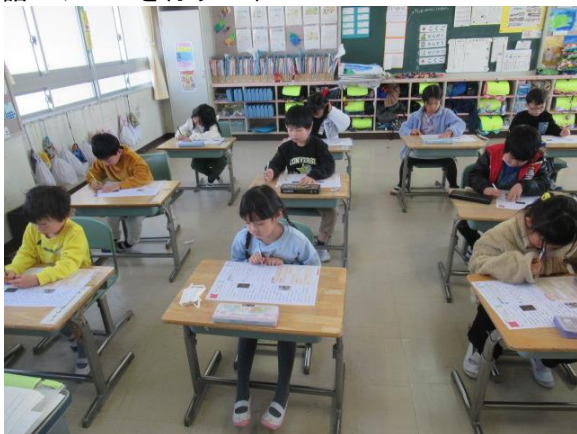
国語のテストを行う1年生