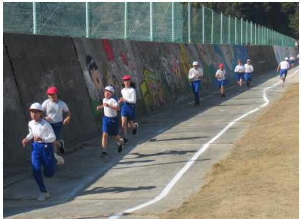
6年生は、最後の持久走大会です