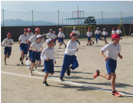
5・6年生の持久走の練習