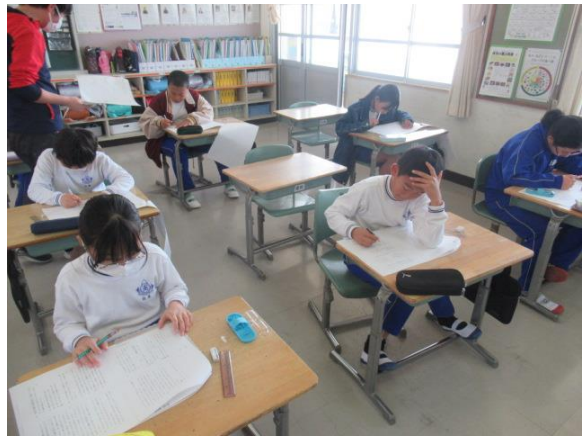
算数の復習プリントを行う4年生