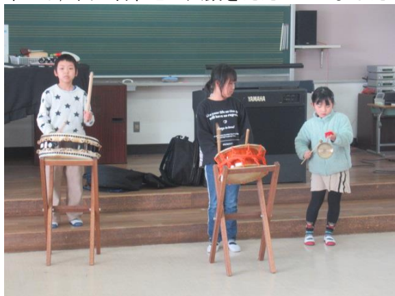
3年生は、曲に合わせて太鼓をたたいていました