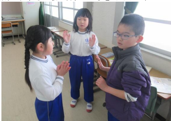
音楽で、わらべ歌に合わせて手をたたく2年生