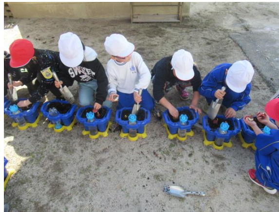
チューリップの球根を植えていました