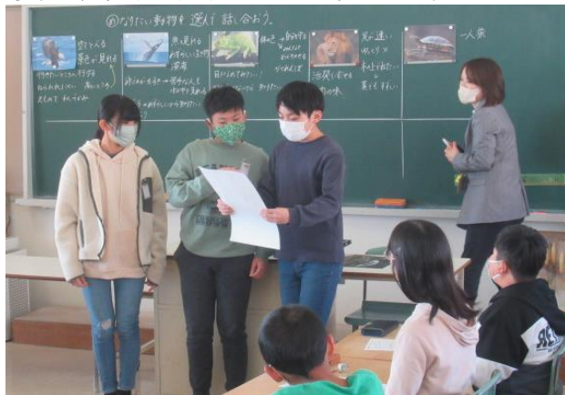
学活で、長所と短所について考える6年生