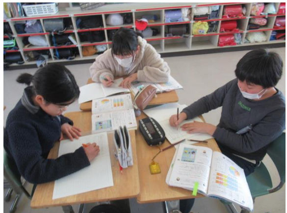
難しい問題は、グループで話し合っていました