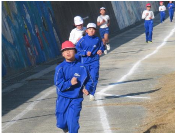
辛くても一生懸命走ります