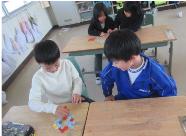
算数で、お金の学習をしていた1年生