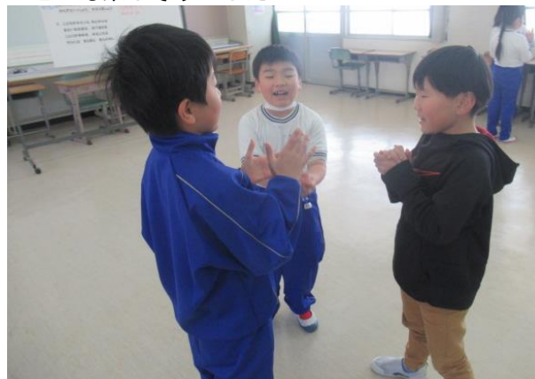
とても楽しそうでした