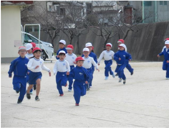
持久走の練習を行う1・2年生