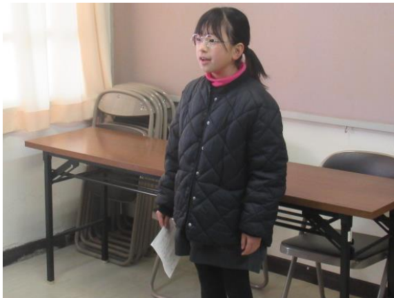
ZOOMで児童朝会を行いました