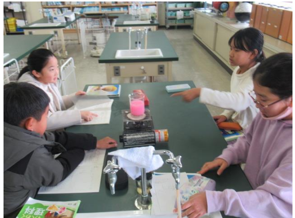
物の温まり方の実験を行う4年生