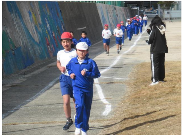
3・4年生は、1200m走っていました