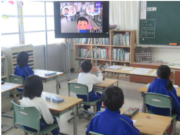
保健・美化委員会が作製した動画を視聴しました