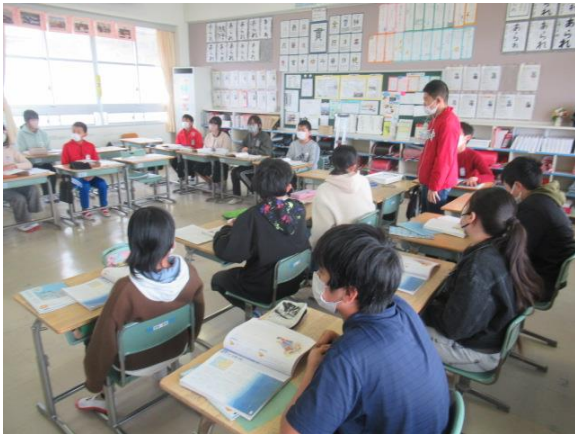
道徳で、家族愛について学習する6年生