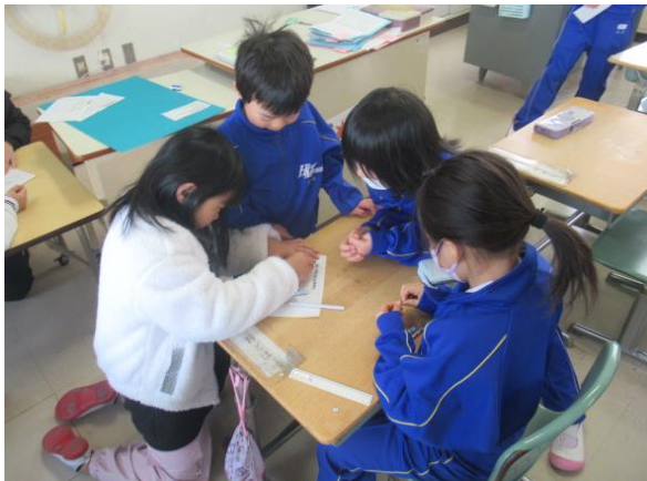
係活動について話し合う1年生