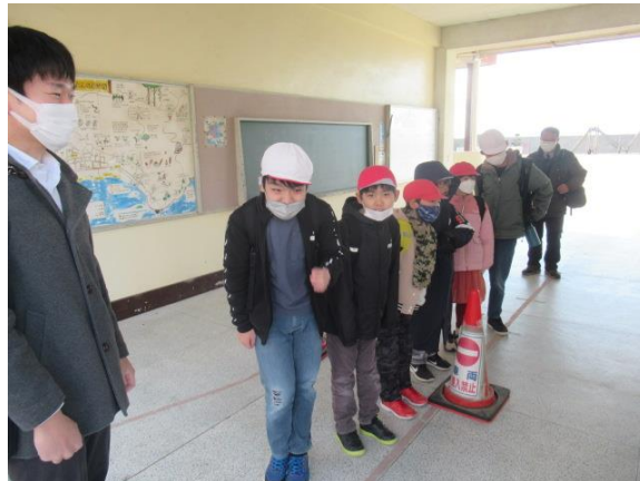
ひまわり学級が合同作品展の見学に出発