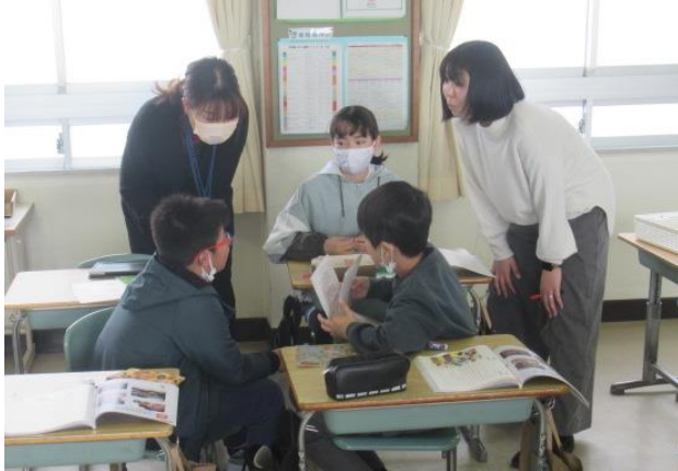
道徳で、伝統文化について学習する5年生