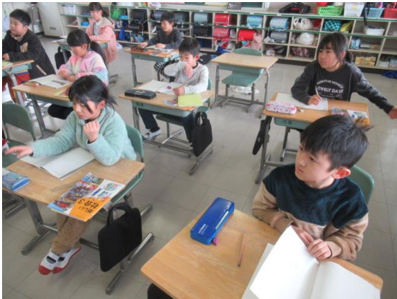
社会科で安全な暮らしについて学習する3年生