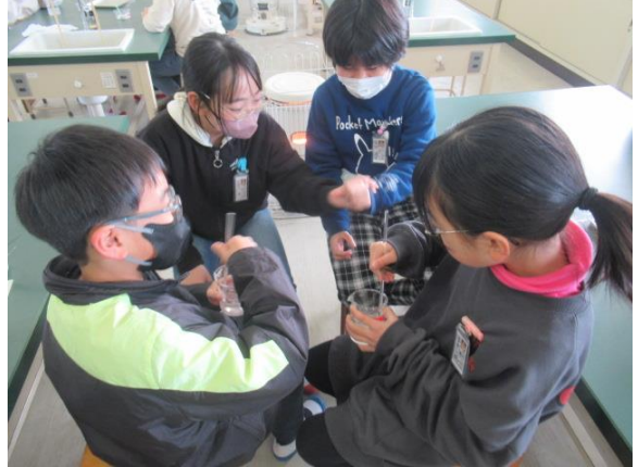
水の量の違いによる物の溶け方を実験していました