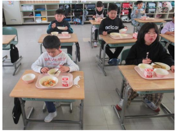
給食の肉じゃがを美味しく食べていました