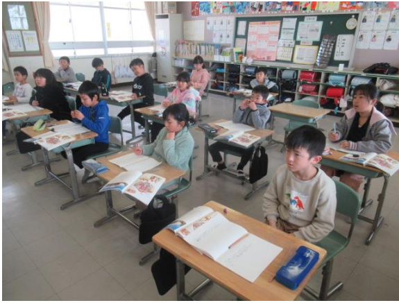
国語の説明文を学習する3年生