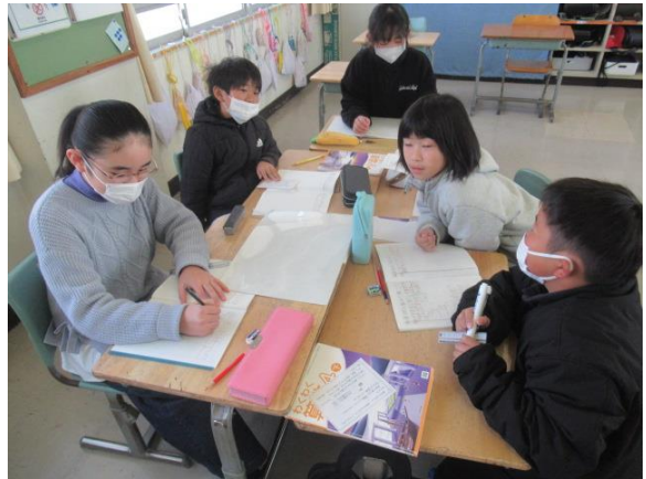
算数で資料の整理の仕方を考えていました