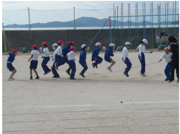
みんなでジャンプに挑戦していました