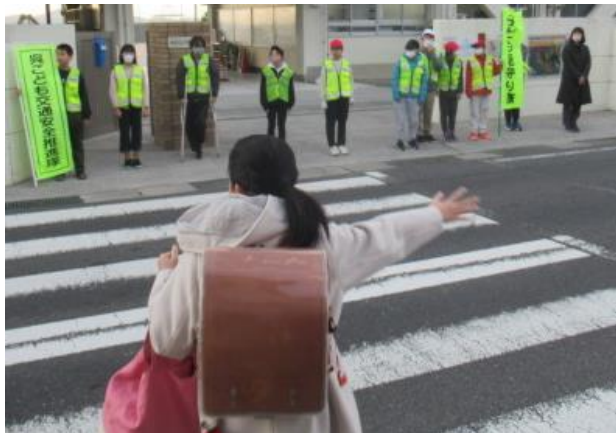
あいさつ運動を行いました