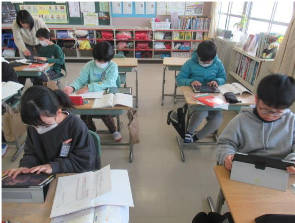
国語で、文章の構成を考える5年生