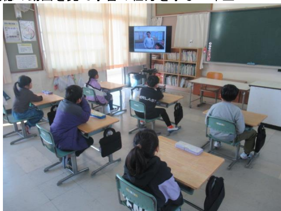
道徳の動画を見て学習の仕方を学ぶ2年生