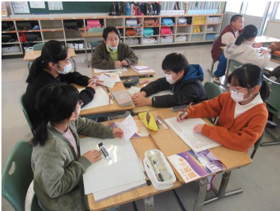
席替えを行い新しいグループで活動する4年生