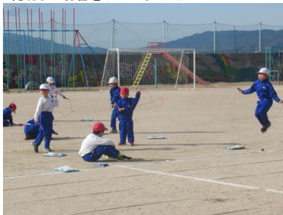
縄跳びの練習をしていました