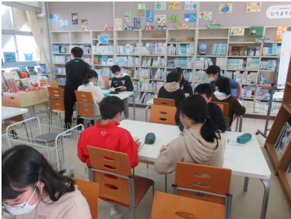
図書室で読書を行う6年生