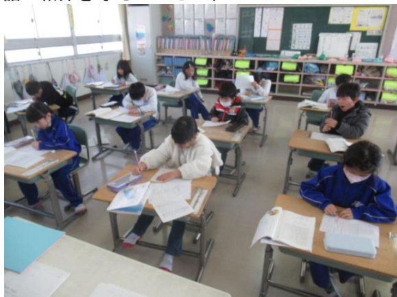
昔話の紹介を考えていた1年生