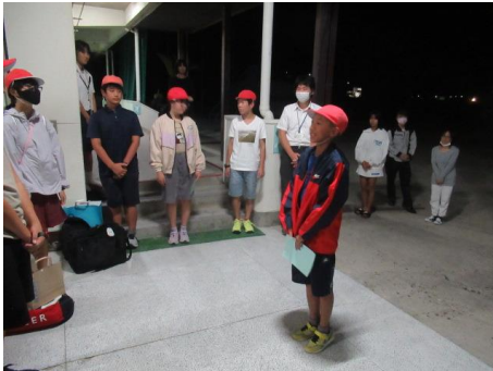
最高の思い出になりましたね