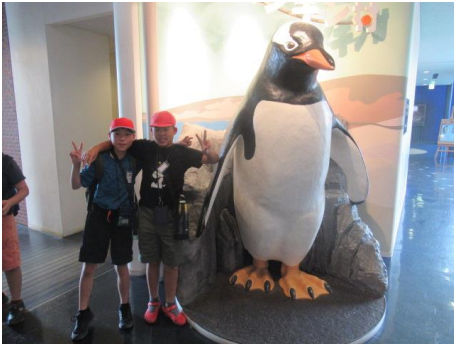
まずは、お土産です