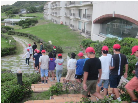
2日目もしっかり楽しみましょう