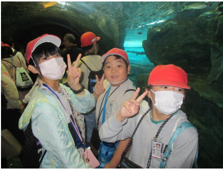
班ごとに記念撮影 1班です