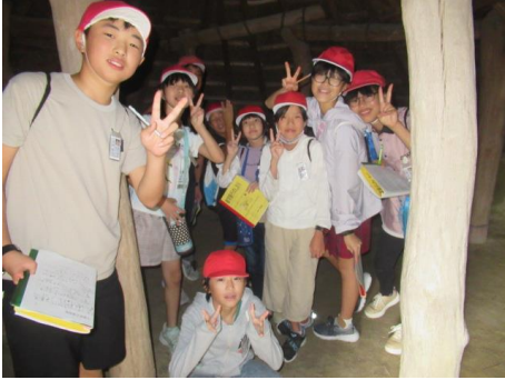
最後の記念撮影です