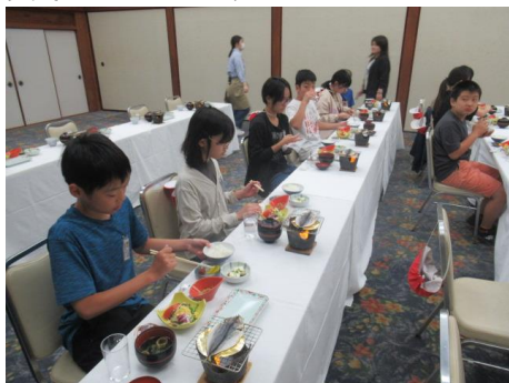
2日間、ありがとうございました