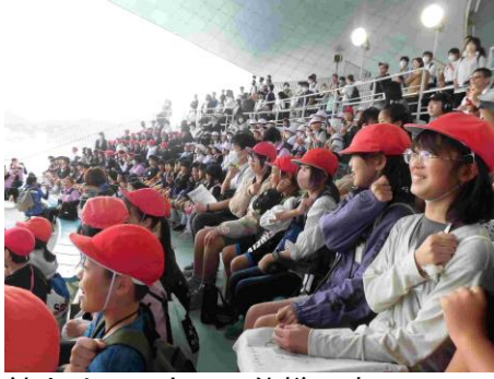
館内はハロウィン仕様です