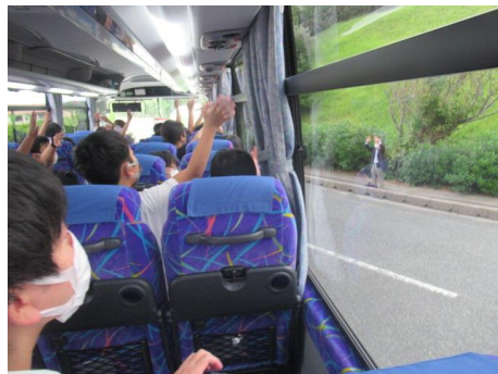
バスの中は、ビンゴゲームで盛りあがる