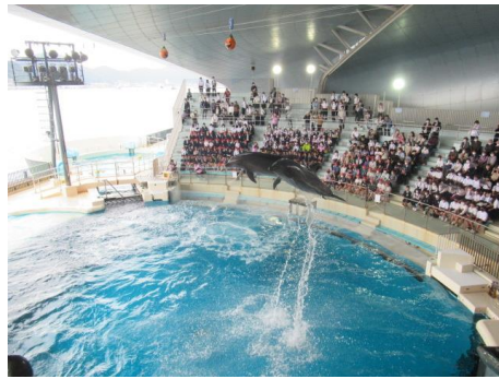
オットセイとイルカは仲良し