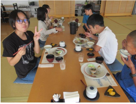
食事は全て美味しかったです