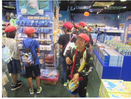
もっと小遣い残しとけば良かった