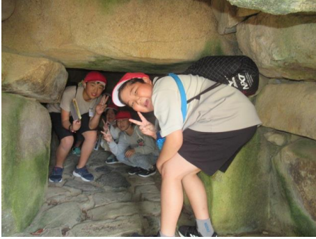
思った以上に広がったです