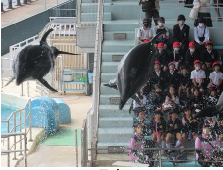
イルカショー、最高でした