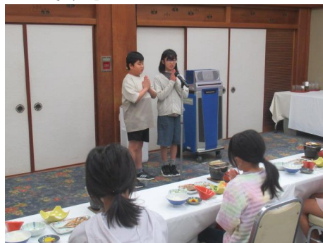
お世話になりました