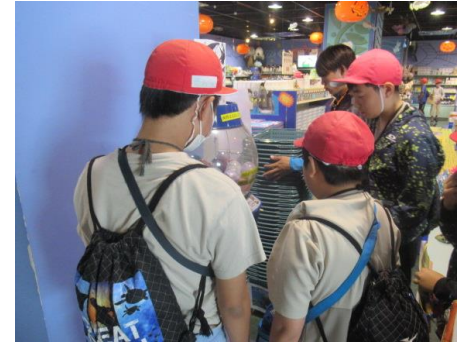
ガチャしていました