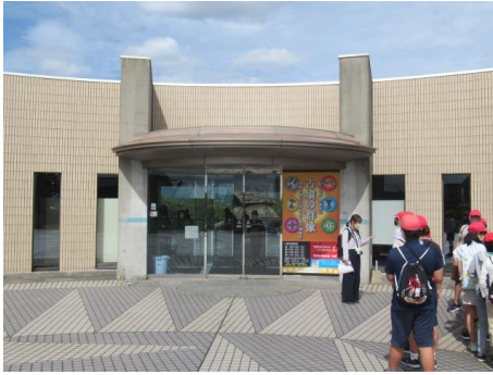
しっかり見学していました