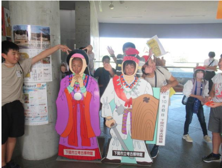
ただいま帰ってきました