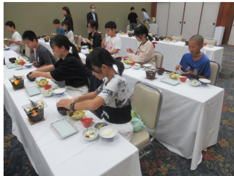
ごちそうさまでした