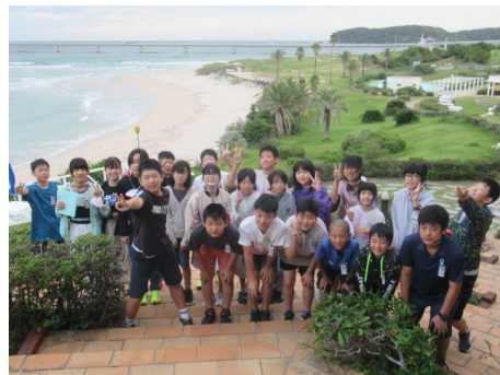
気持ちの良いラジオ体操