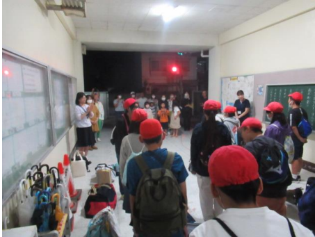
最高の思い出になりましたね