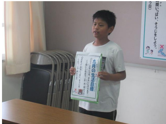
5年生は、振り返りの発表が上手でした