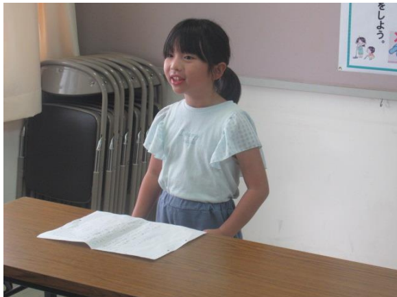
9月の生活目標の振り返りを発表する3年生