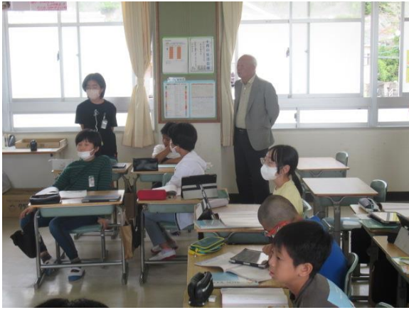
道徳で、公平・公正について学習する5年生