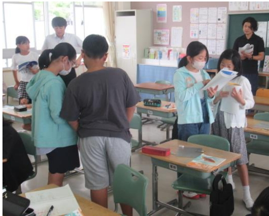
算数で、積極的に意見交流を行う4年生