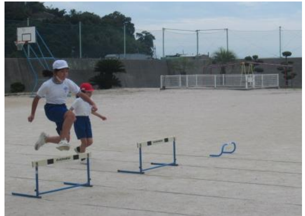
体育で、ハードル走の練習をしていました