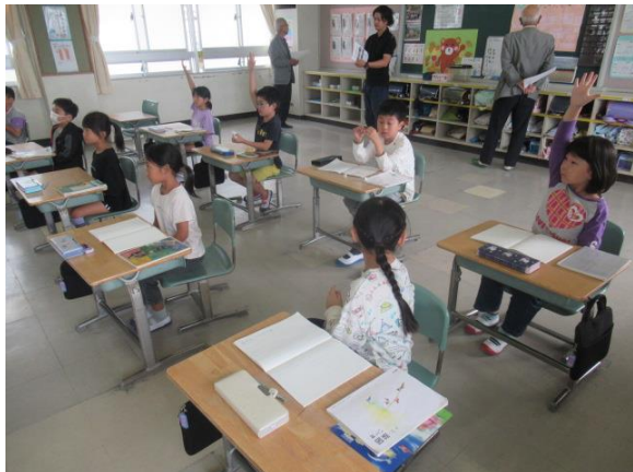
国語のお話を絵を見てお話を考える2年生