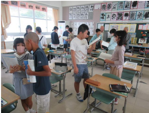
算数で、比の表し方についてペアトークを行う6年生