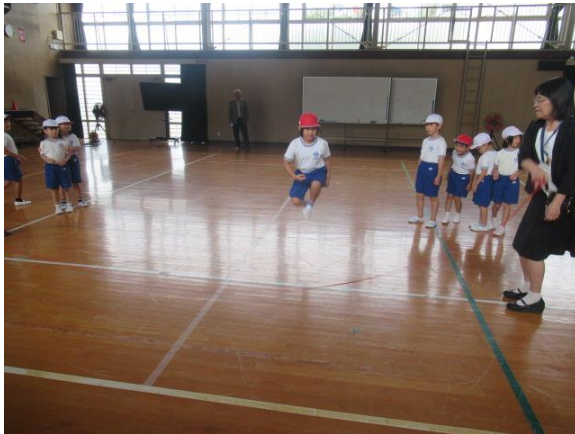
くれチャレンジマッチに挑戦する1年生