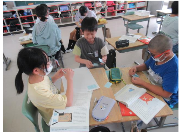
グループ交流が活性化していました