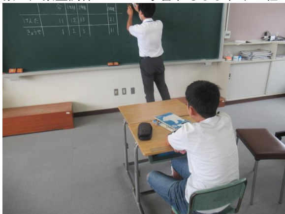
算数で、数量関係について学習するひまわり1組