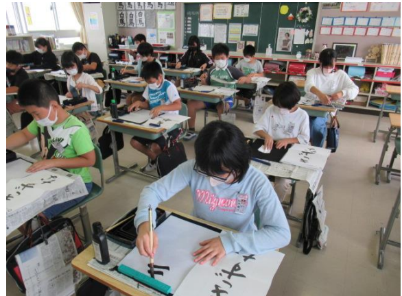
習字で「きずな」を書いていました