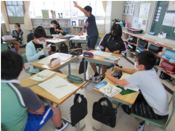
算数で、グループ協議を行う5年生