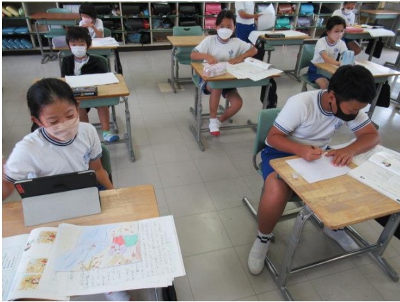
自分が考えた物語の絵を描いていた3年生