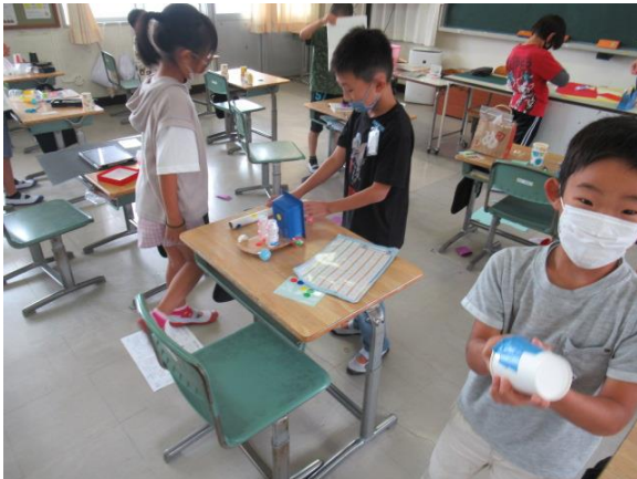
図工で「動くおもちゃ」を作っていた2年生