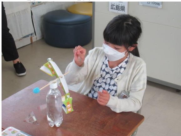
天びんを使って重さを調べていました