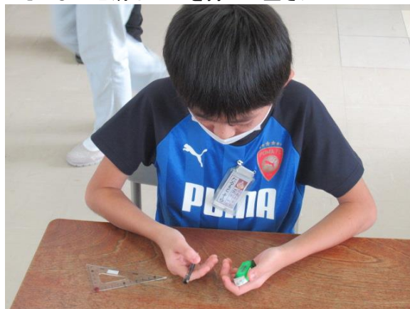
えんぴつと消しゴムを持って重さ比べ