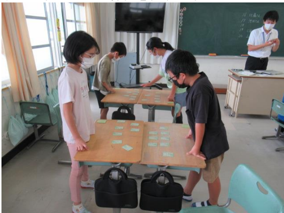
百人一首カルタの練習を行う4年生