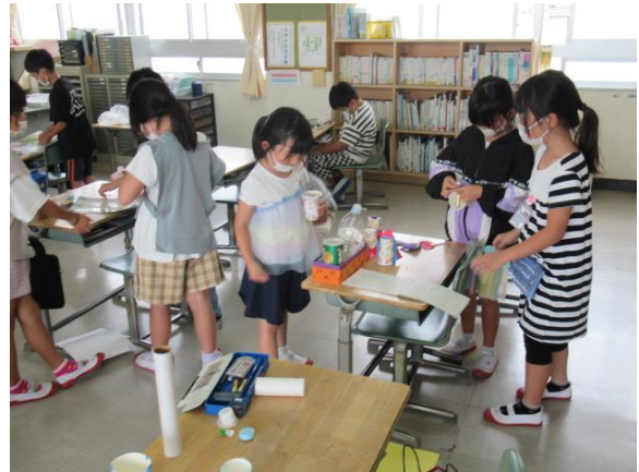
楽しそうな動くおもちゃができていました