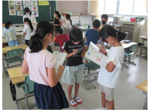
外国語活動で、楽しくグループトーク