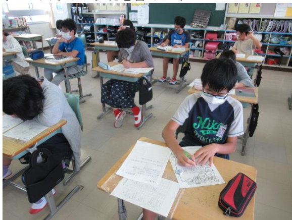
昨日の虫干しのお礼を書く6年生