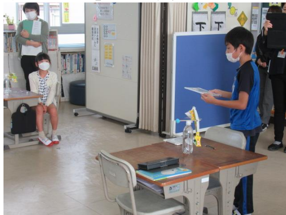
分かったことをお互いに発表していました